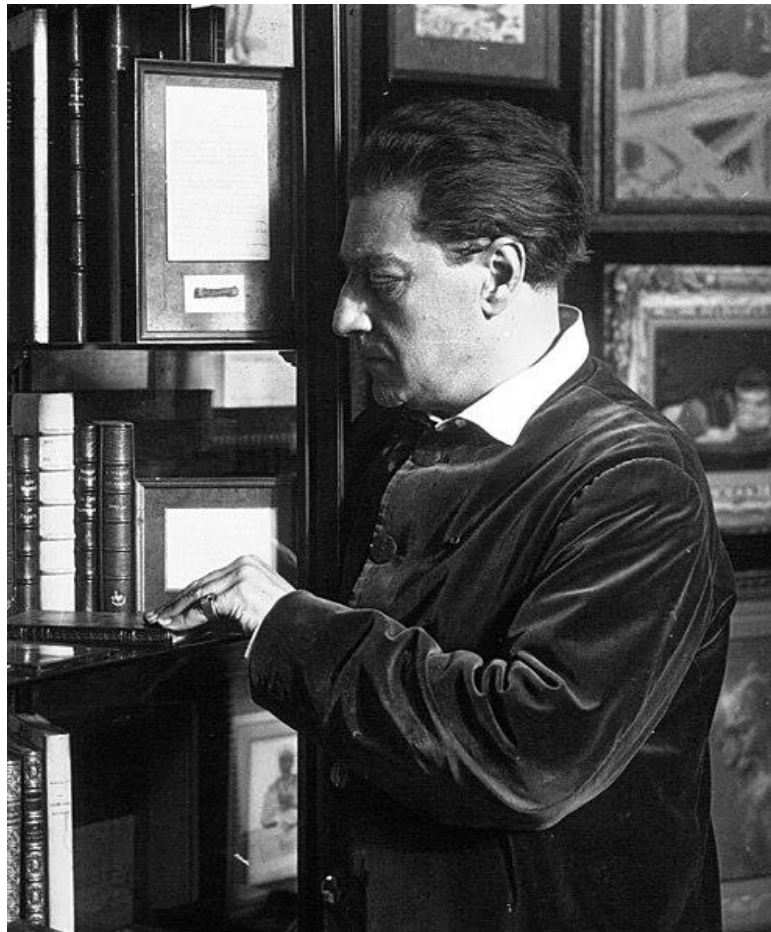
Sacha Guitry en 1931