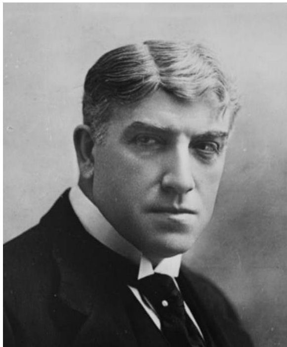
Lucien Guitry vers 1909

Admiratif de ce père comédien surnommé le Sanglier des planches , le jeune Guitry l'observe et débute sur scène avec lui, pourtant, Sacha bâtira sa carrière tout seul.