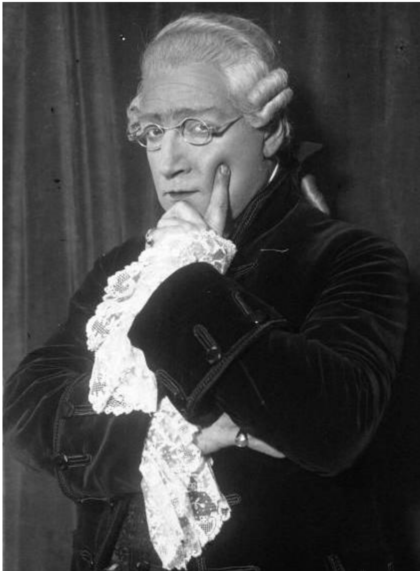
Sacha Guitry jouant le rôle de Grimm dans sa comédie musicale Mozart en 1926.

Selon acte n°965 Archives de Paris en ligne - 7D 248 - vue 3/31