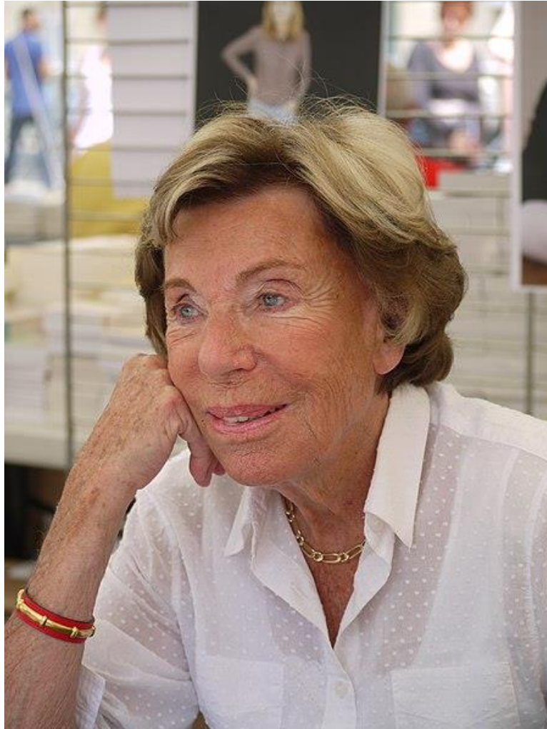
Benoîte Groult en 2010