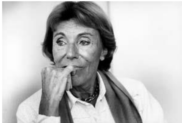
Benoîte Groult en 1983

La même année, elle préface La parole aux négresses par Awa Thiam, ouvrage fondateur du féminisme africain.