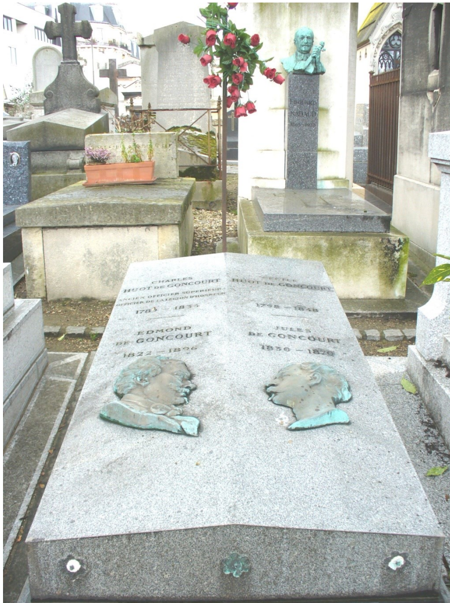
Sépulture de Jules et Edmond de Goncourt au cimetière de Montparnasse à Paris.

Poursuivi ensuite par Edmond, le Journal , composé de notes prises au jour le jour, est considéré aujourd'hui comme un témoignage intéressant sur la seconde moitié du 19 e siècle.