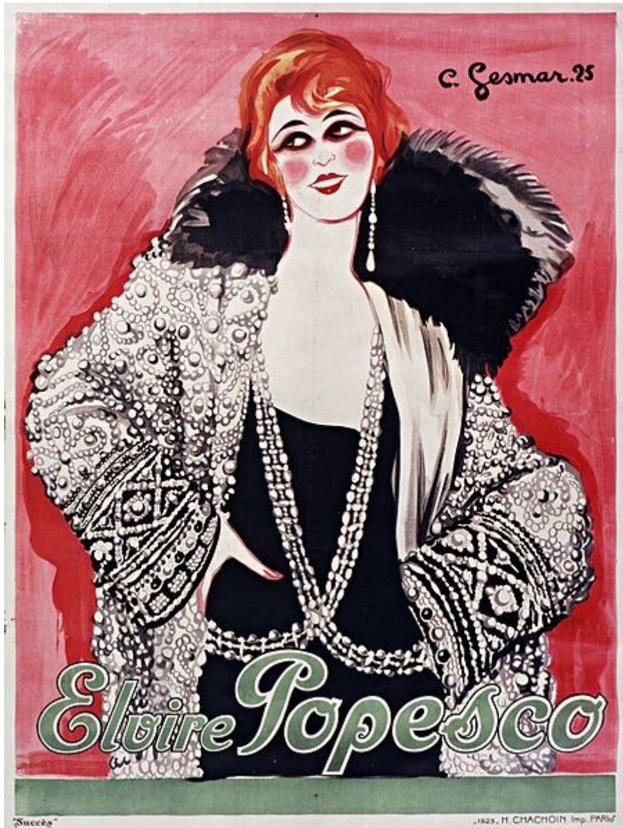
Elvire Popesco – affiche 1925