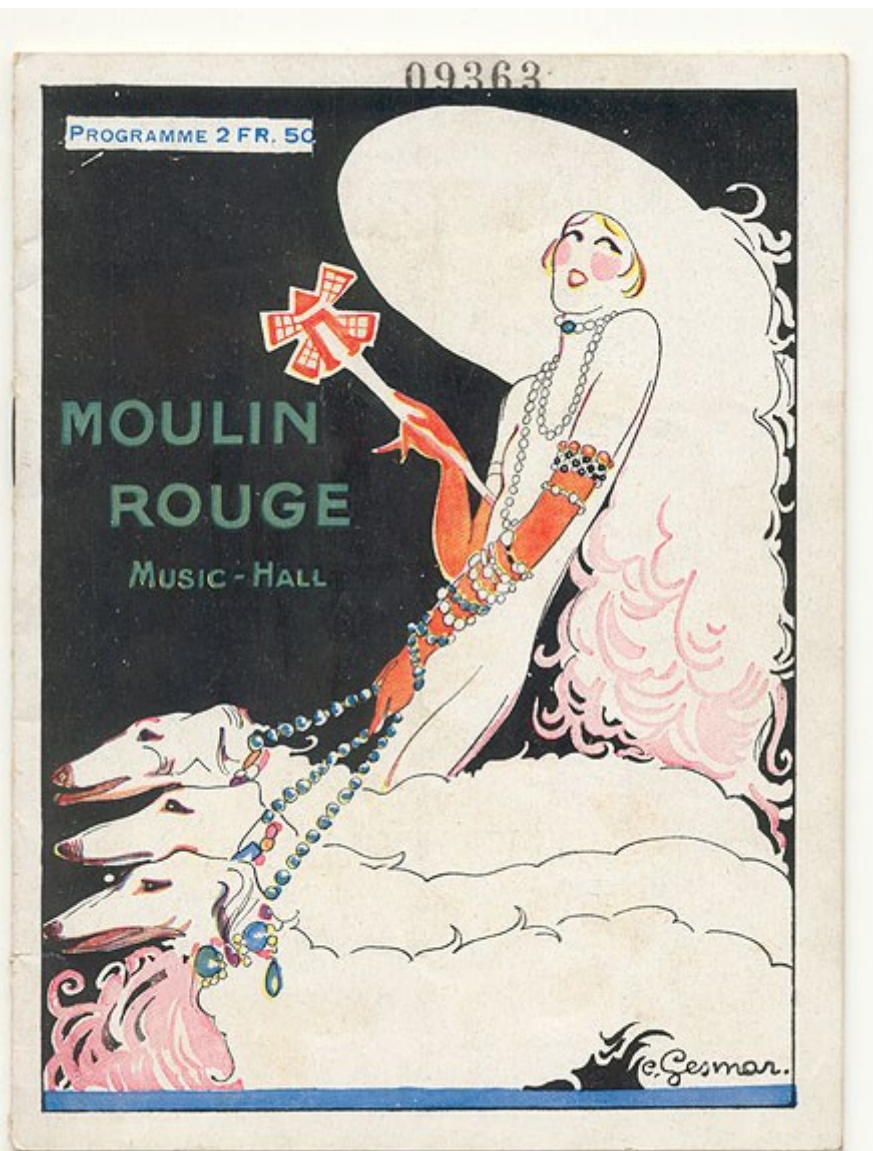
Illustration de la couverture du programme d'un spectacle au Moulin Rouge (vers 1925).

A-t-il hérité de son père, négociant en tissus, le goût de s'intéresser aux vêtements et dessiner les costumes de scène d'abord pour l'actrice vedette Spinelly dès 1915 ? Pendant un temps, il remplace auprès d'elle son costumier préféré Paul Poiret .