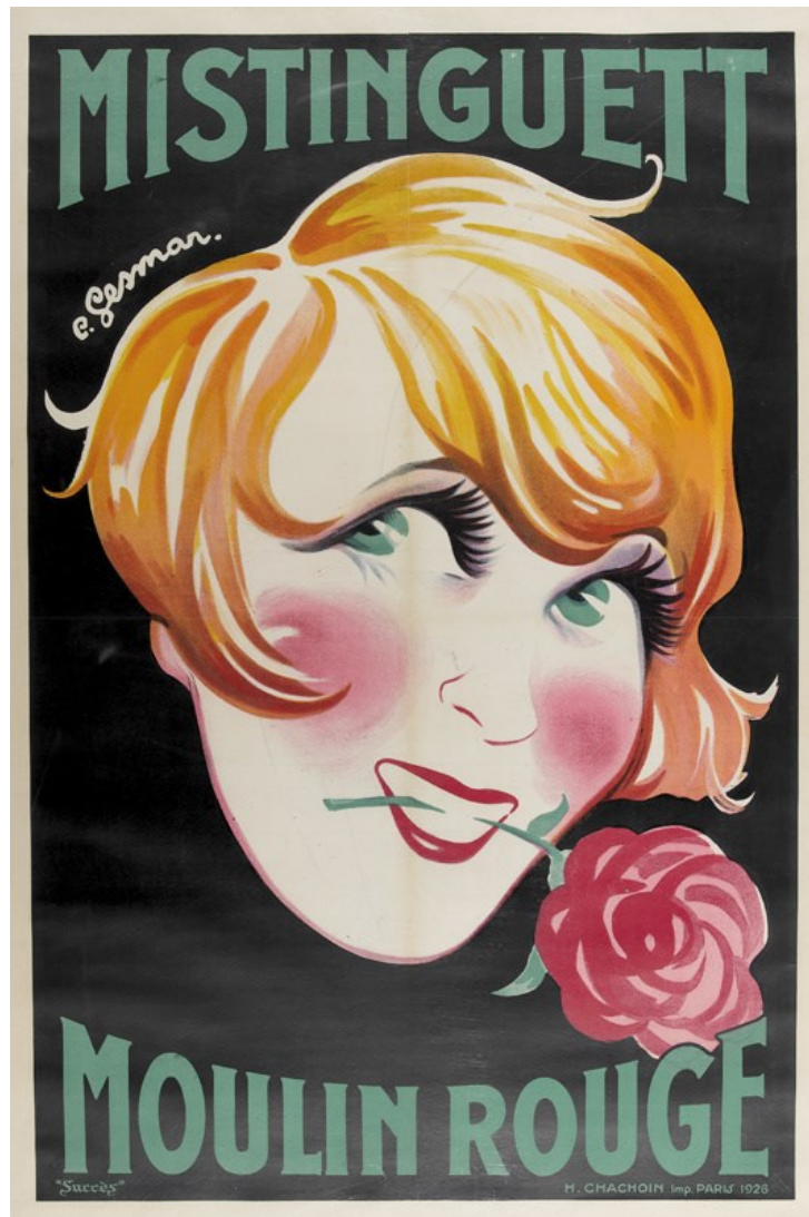
Mistinguett Moulin Rouge (1926), lithographie en couleur.