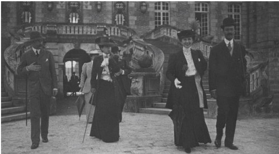
Avec sa sœur la comtesse de Béarn (à gauche)