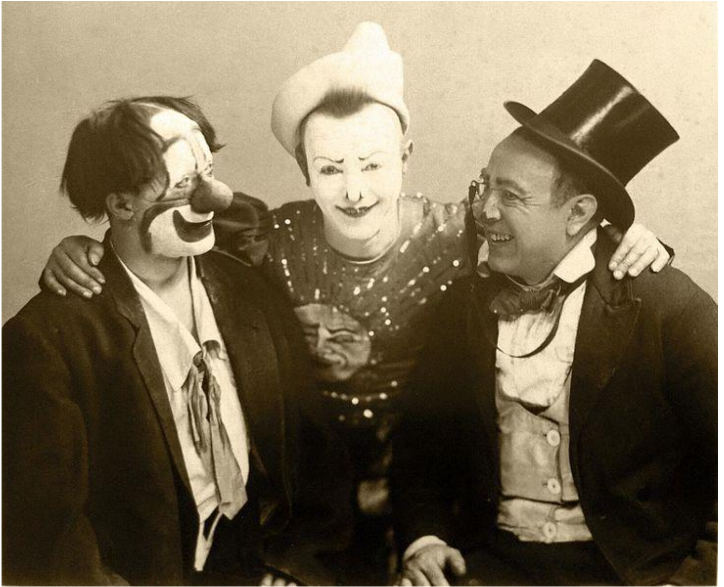
Albert, François (au centre) et Paul Fratellini.