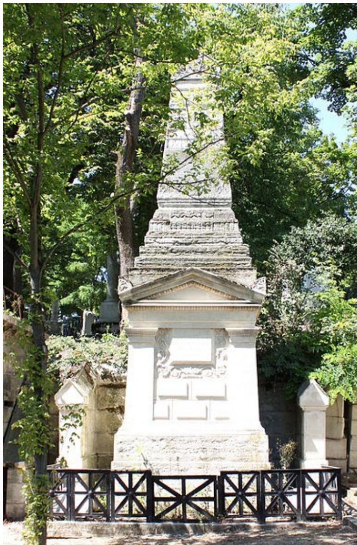
Tombeau de Guillaume Dupuytren au cimetière du Père-Lachaise

Son talent et sa réputation lui permettent d'amasser une grande fortune estimée à 3.000.000 francs en 1830. Il en offre le tiers à Charles X exilé. Il lègue à la Faculté de médecine une somme de 200.000 francs qui sert à fonder une chaire d'anatomie pathologique et à créer le musée anatomique éponyme : le musée Dupuytren.