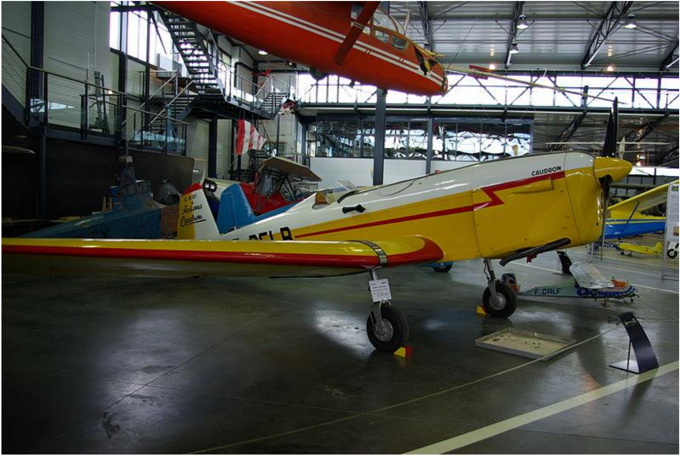
Caudron-Renault aiglon C601 - Musée régional de l'air d'Angers-Marcé