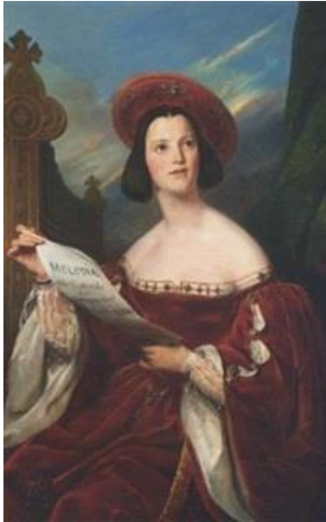
Melodia 1837 par Louis Ducornet