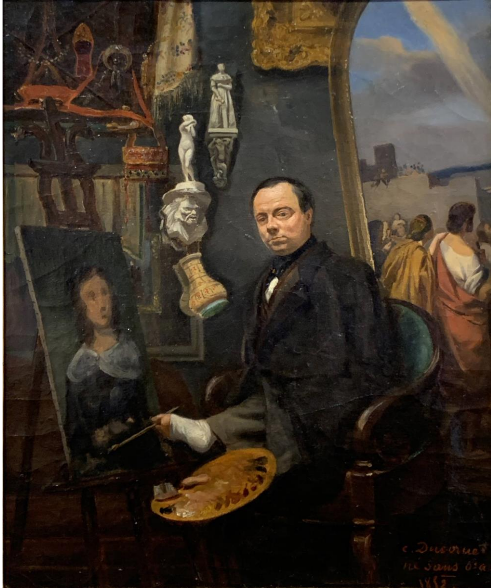
Autoportrait de Ducornet en 1852