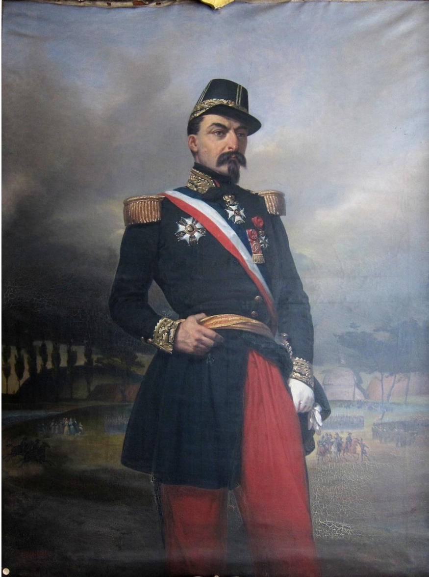
Portrait du général François de Négrier sur le Champs-de-Mars à Lille