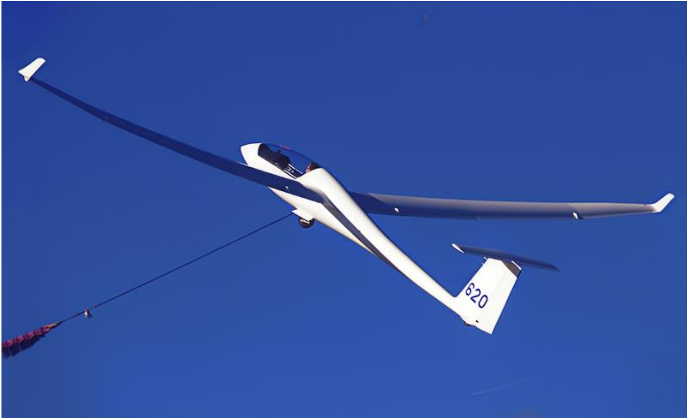
Planeur en décollage au treuil.