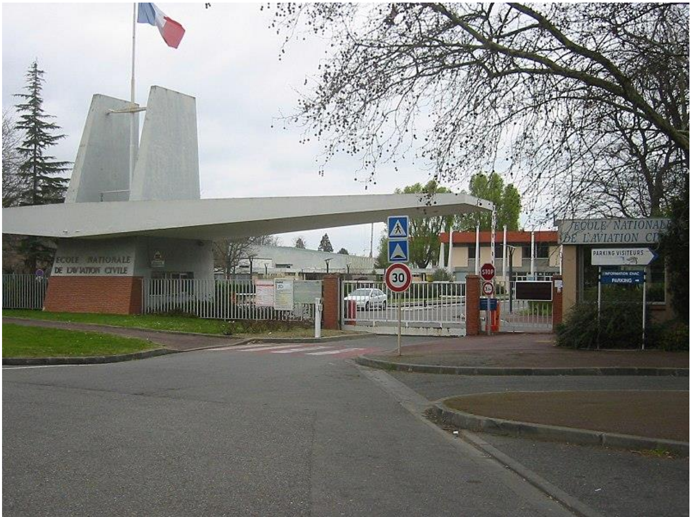
ENAC (École Nationale de l'Aviation Civile) fondée en 1949 et ouverte aux femmes en 1973.