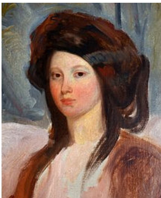
Juliette Drouet dans le rôle de la princesse Negroni . Portrait peint par Charles-Émile Callande de Champmartin.

Juliette avec son charme et sa douceur devient la maîtresse du célèbre romancier qui se fait exigeant et possessif au point qu'elle arrête sa carrière théâtrale. Pour lui, elle se confine chez elle, renonce à ses prétendants et à la compagnie de ses amies pour ne sortir qu'au bras du très courtisé Mr Hugo. Leur liaison est notoire et affichée y compris de l'épouse du poète et de leurs enfants.