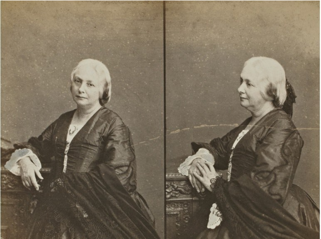
Double portrait de Juliette Drouet par Arsène Garnier, 1868.

Décédée le 11 mai 1883, elle est inhumée à Saint-Mandé près de sa fille Claire, mais Victor Hugo sera absent, dissuadé par ses proches d'y assister.