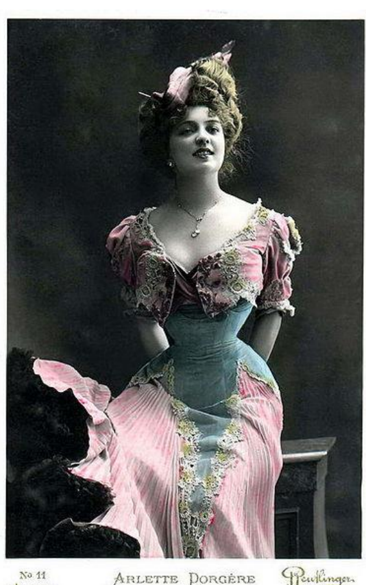
Photos d'Arlette Dorgère avant 1914