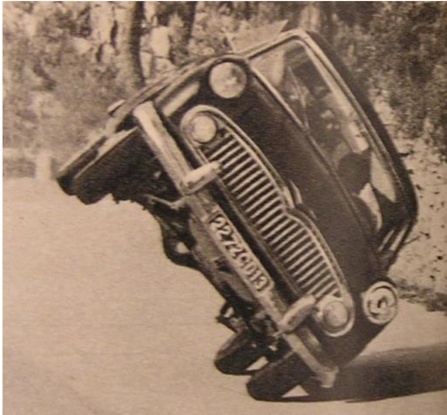
Gil Delamare sur deux roues