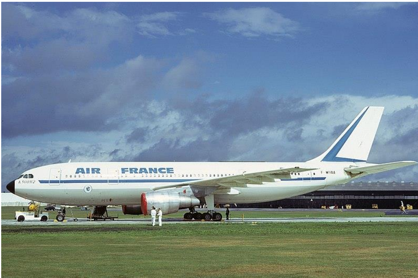
Airbus A300 en 1974