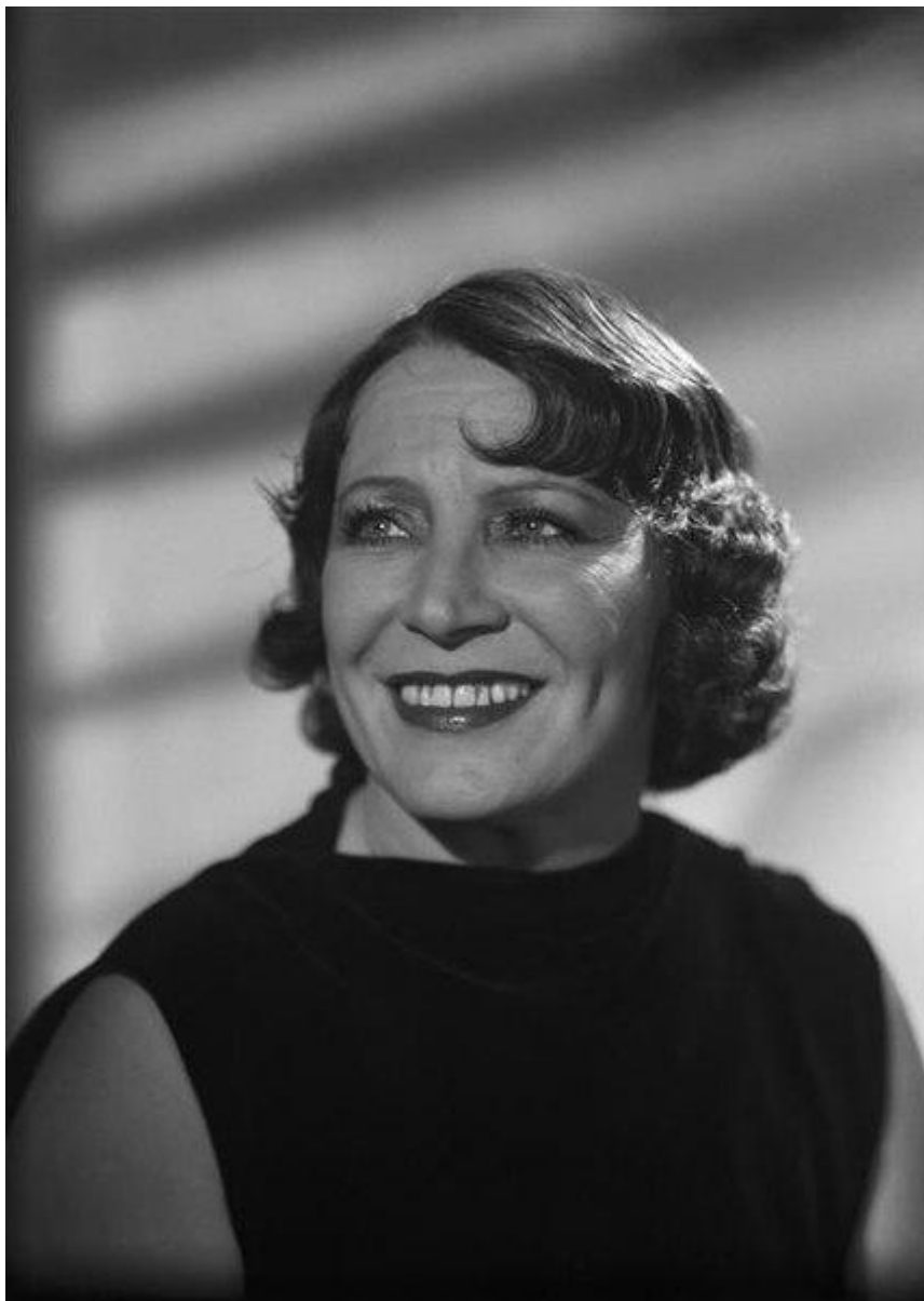
Damia - Studio Harcourt 1939

En même temps, elle tient quelques rôles marquants au cinéma.