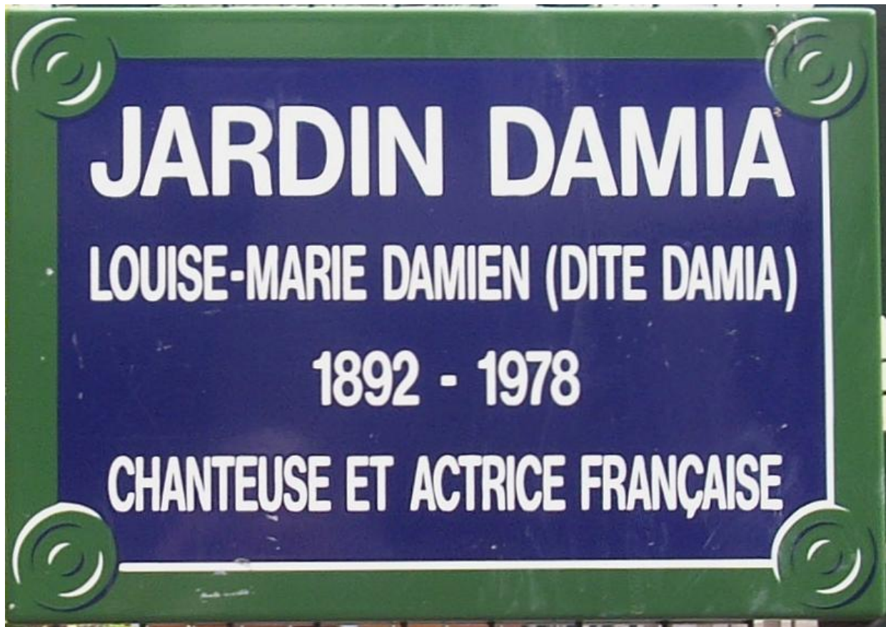
Un square de Paris 11 e rend hommage à Damia (Année de naissance erronée sur cette plaque).

En 1978, elle décède d'une chute accidentelle sur les voies du métro parisien.