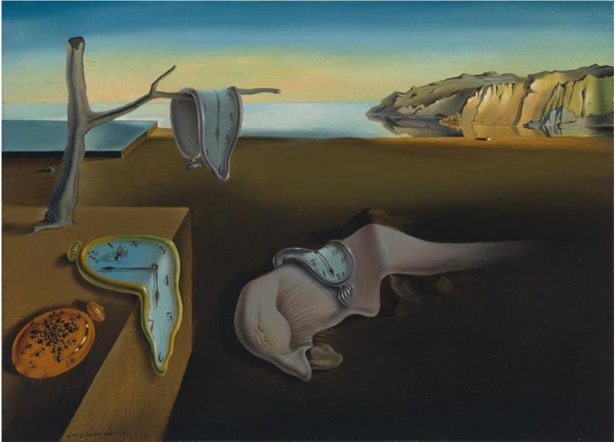
La persistance de la mémoire – tableau peint par Dali en 1931 Tableau connu dans le grand public sous le nom « les montres molles »

La fortune aidant, la minuscule maison de pêcheur acquise par Dali près de Cadaqués deviendra fastueuse villa convertie aujourd'hui en musée.