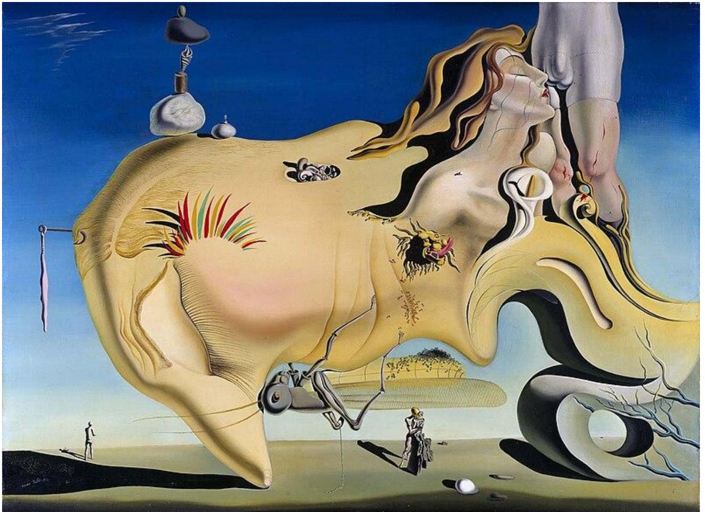
Salvador Dalí 1929

- 100 personnages qui ont marqué le siècle, Sélection du Reader's Digest