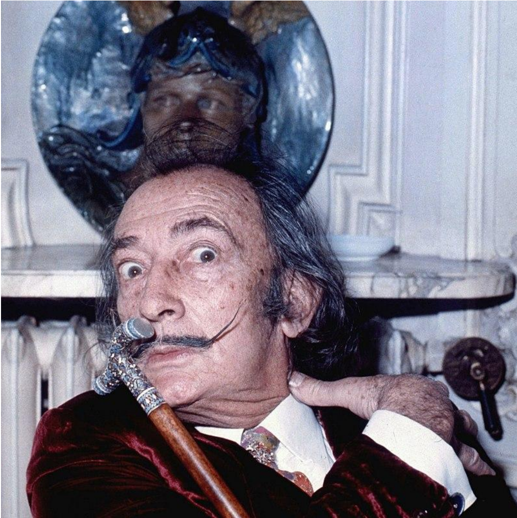
Dali en 1972