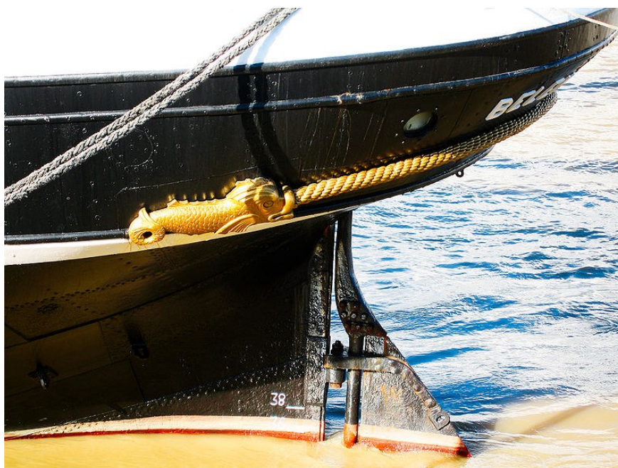
Détail de la poupe du Belem

En 1914, la Guerre mondiale arrête sa carrière commerciale concurrencée par les « vapeurs » plus rapides.