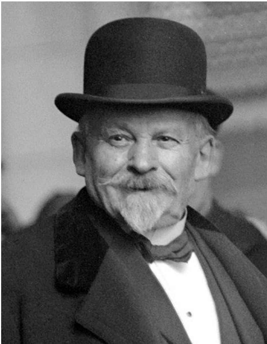
Émile Coué en 1917

Décédé le 2 juillet 1926 à Nancy Meurthe-et-Moselle 54