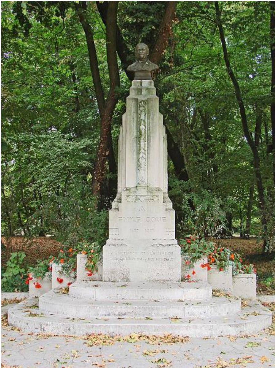
Monument à Émile Coué à Nancy

C'est que, dans le premier cas, les hommes s'imaginent qu'ils doivent marcher en avant et que, dans le second, ils s'imaginent qu'ils sont vaincus et qu'il leur faut fuir pour échapper à la mort.