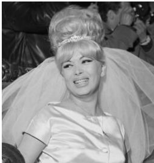
Coccinelle lors de son mariage médiatisé en 1961

Dans les années 1960, elle s'illustre entre films et disques.