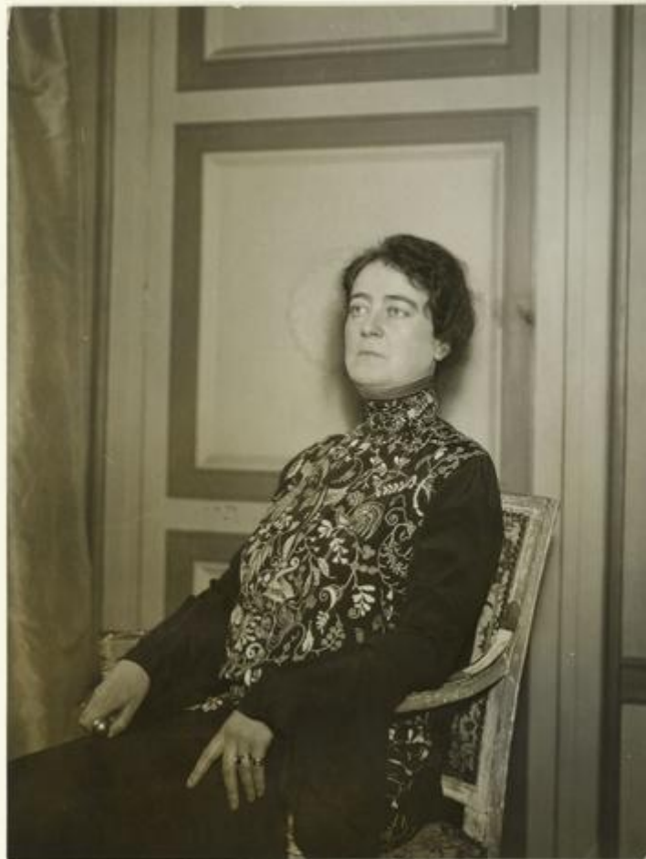
La duchesse dans son hôtel particulier parisien

Décédée à 79 ans, elle repose dans la chapelle funéraire privée des Clermont-Tonnerre à Glisolles dans l'Eure.