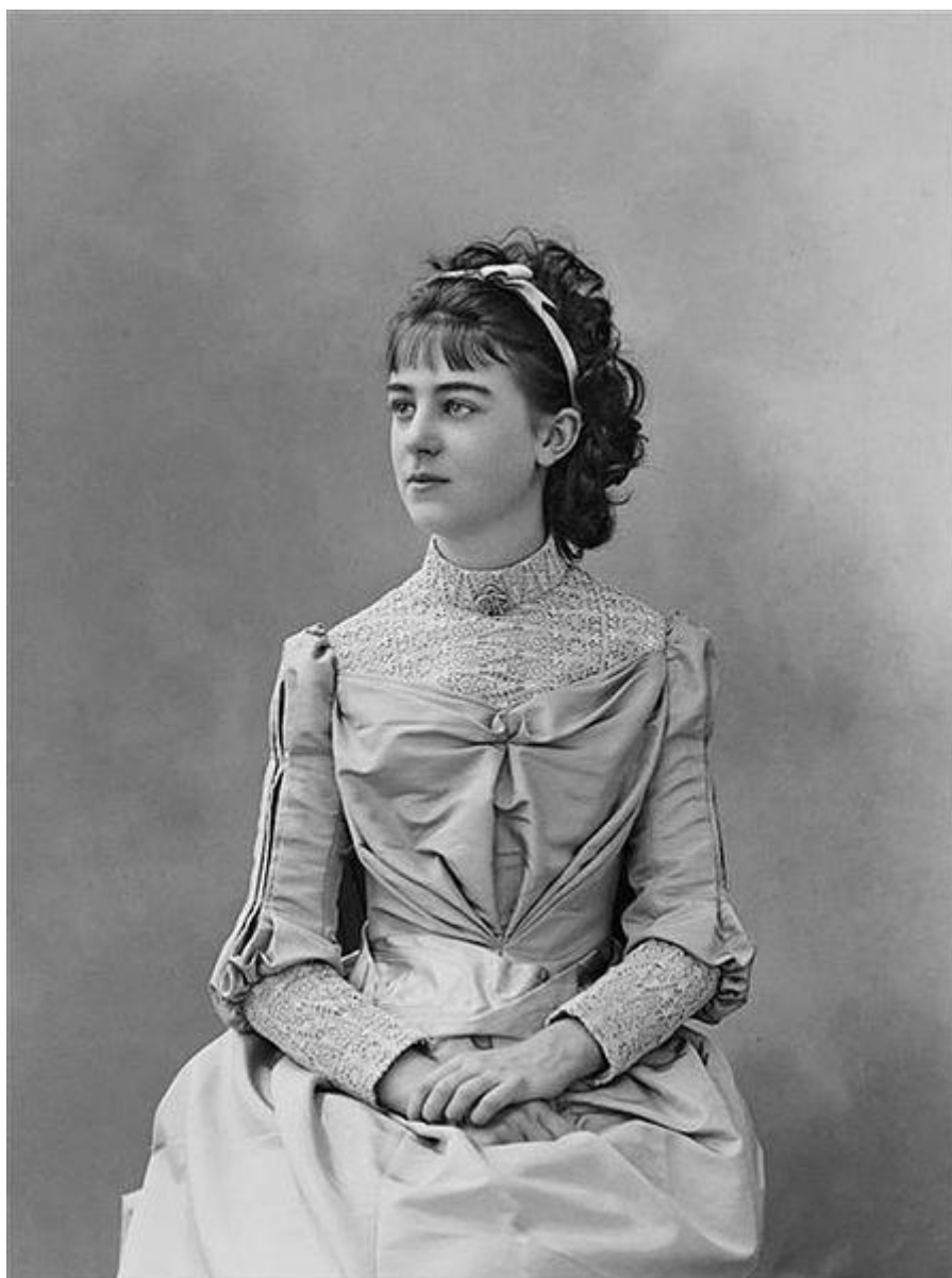
Élisabeth de Gramont par Paul Nadar en 1889.

Selon acte n°2011 - Archives de Paris en ligne – 16D 194 – vue 3/20