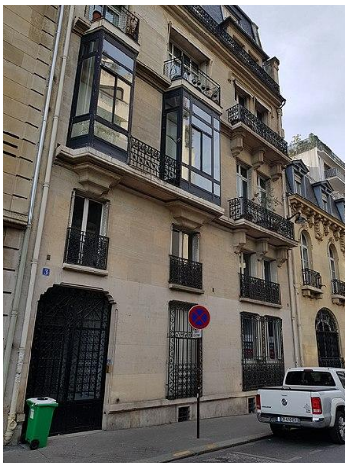
Dernière demeure d'Elisabeth de Clermont-Tonnerre 3, rue de la Faisanderie Paris 16 e

Elle est furieuse, comme ses sœurs, de voir son père Agénor duc de Gramont, deux fois veuf, se remarier en 1907, avec une jeune duchesse italienne, qui ne tardera pas à le tromper vu la différence d'âge.