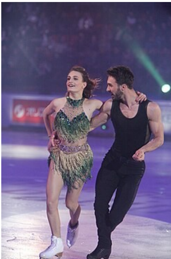
Guillaume Cizeron et Gabriella Papadakis aux Trophées de France 2018