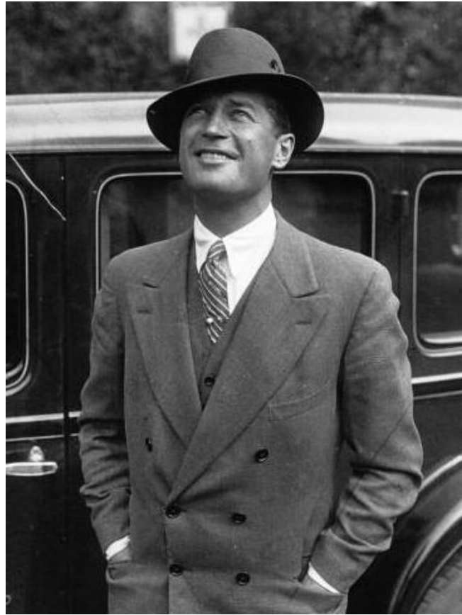
Maurice Chevalier en 1929