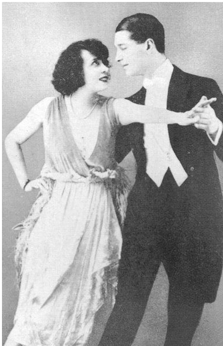
Maurice Chevalier et Mistinguett en 1910

Il inspire la future écrivaine Colette , rencontrée lors d'une tournée provinciale, qui l'évoquera dans son roman La Vagabonde sous les traits de Cavaillon .