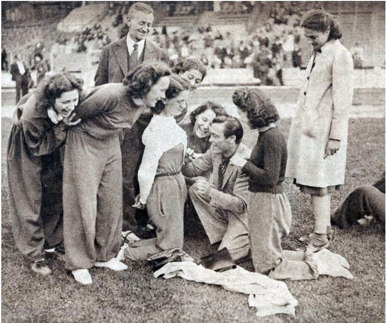
Sacré champion d'Europe un mois plus tôt, Marcel Cerdan signe des autographes à des admiratrices à Colombes en juin 1939.

Le palmarès officiel de la carrière de Marcel Cerdan se solde par 110 victoires dont 65KO pour seulement 4 défaites.