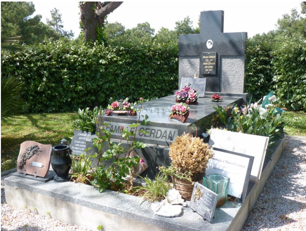
Tombe de Marcel Cerdan au cimetière du Sud à Perpignan

Grâce à la montre-bracelet offerte par Édith, le corps de Marcel sera identifié et rapatrié à Casablanca où 75.000 personnes l'accompagneront pour l'inhumation.