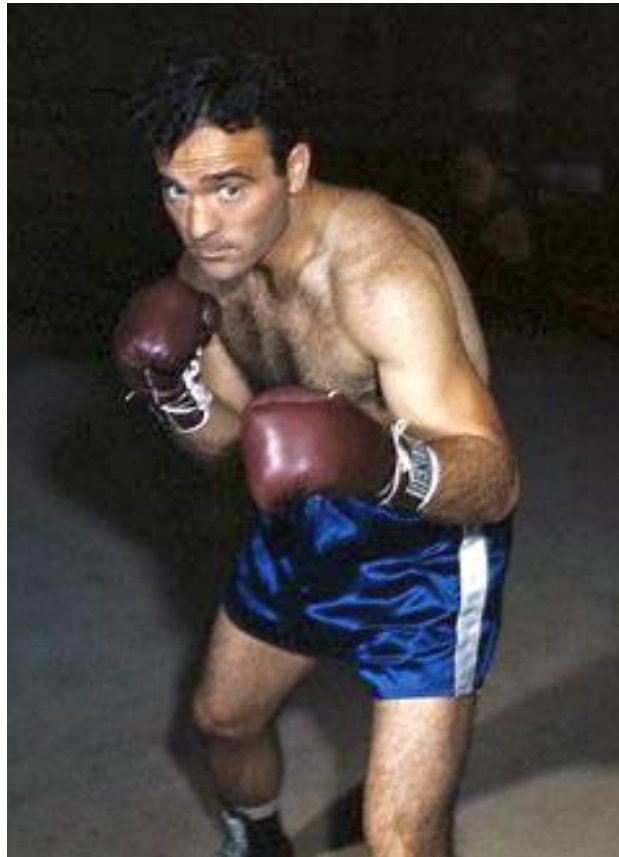
Marcel Cerdan le 12 octobre 1948

Décédé le 28 octobre 1949 Île de Sao Miguel Archipel des Açores