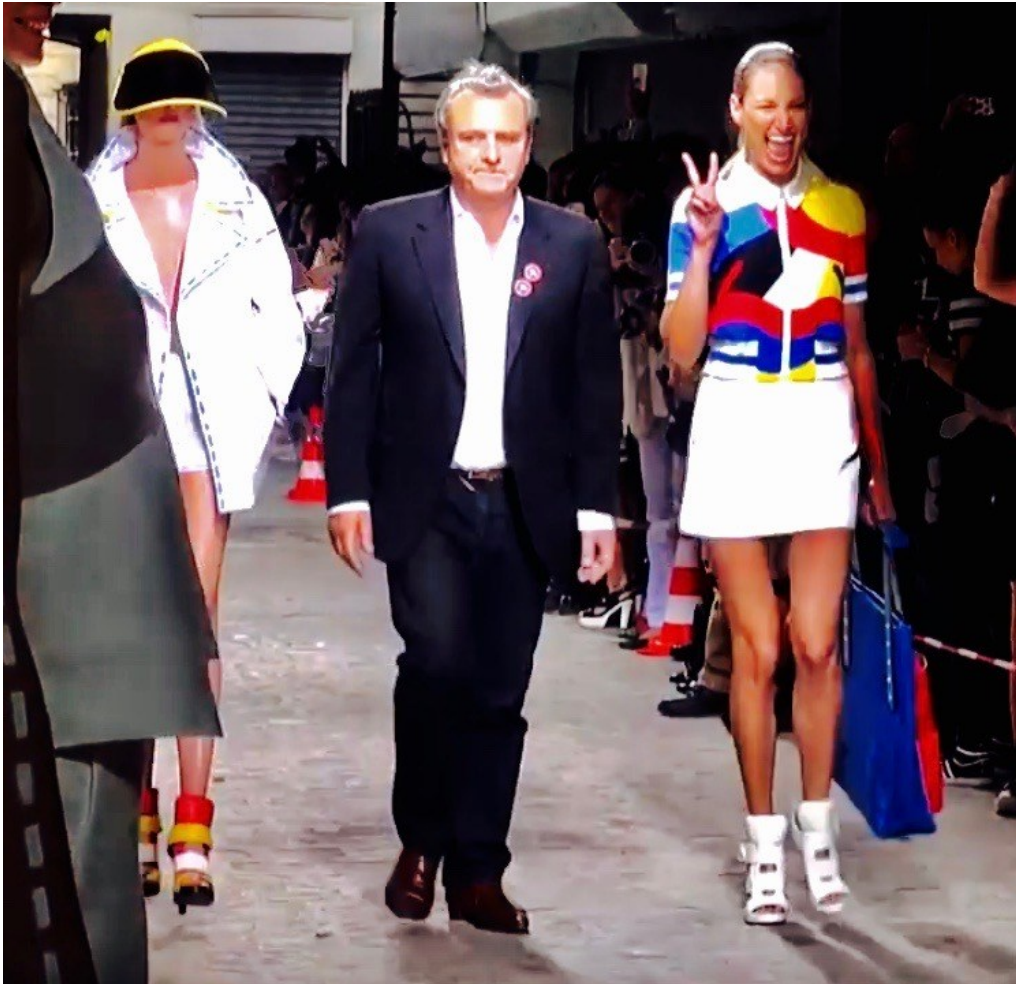
Jean-Charles de Castelbajac lors d'un défilé de mode en 2014