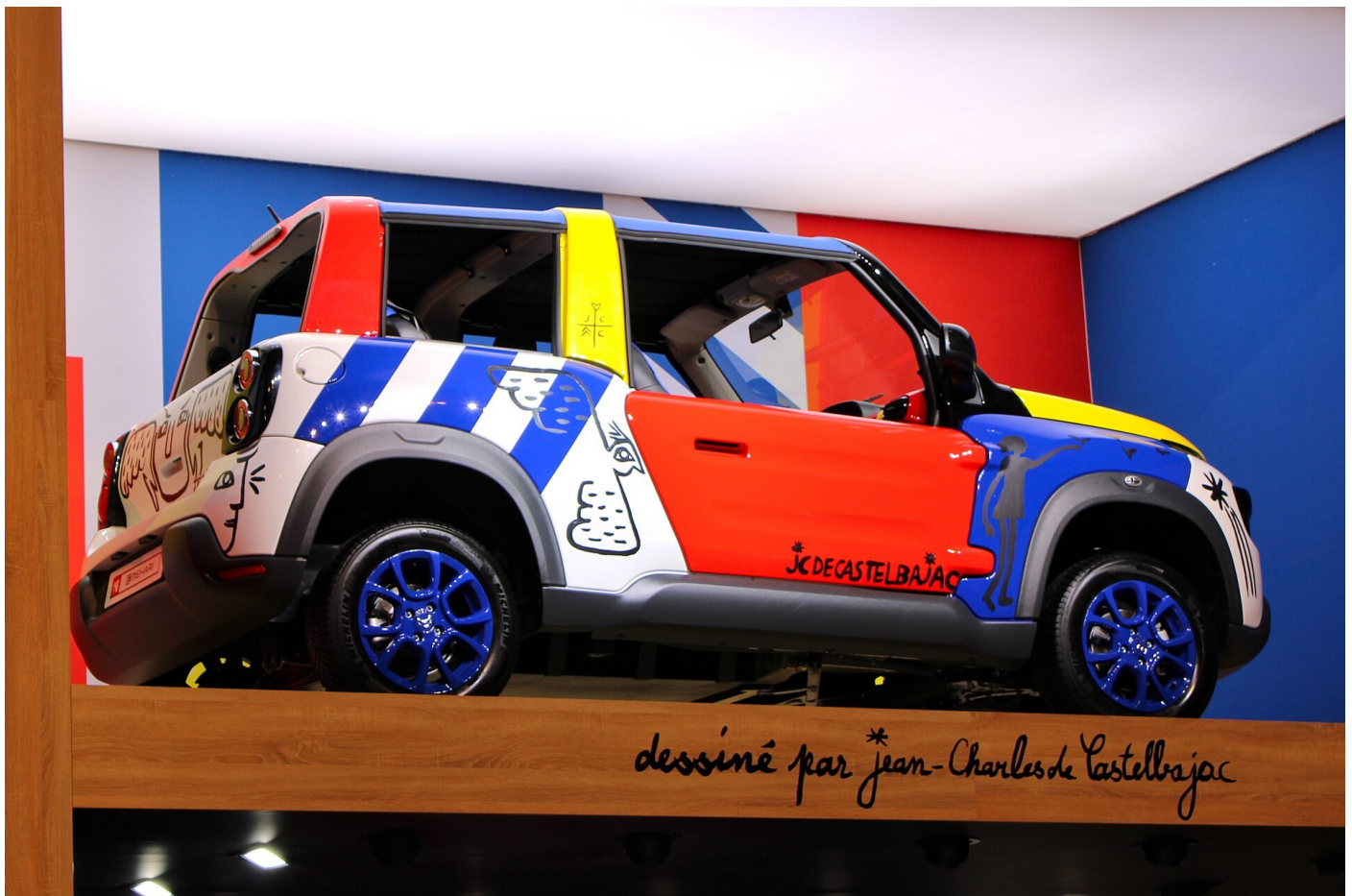
L'art de Castelbajac appliqué à la Citroën Méhari

En créant des accidents esthétiques, on commence une écriture et un style. (JC-DC)