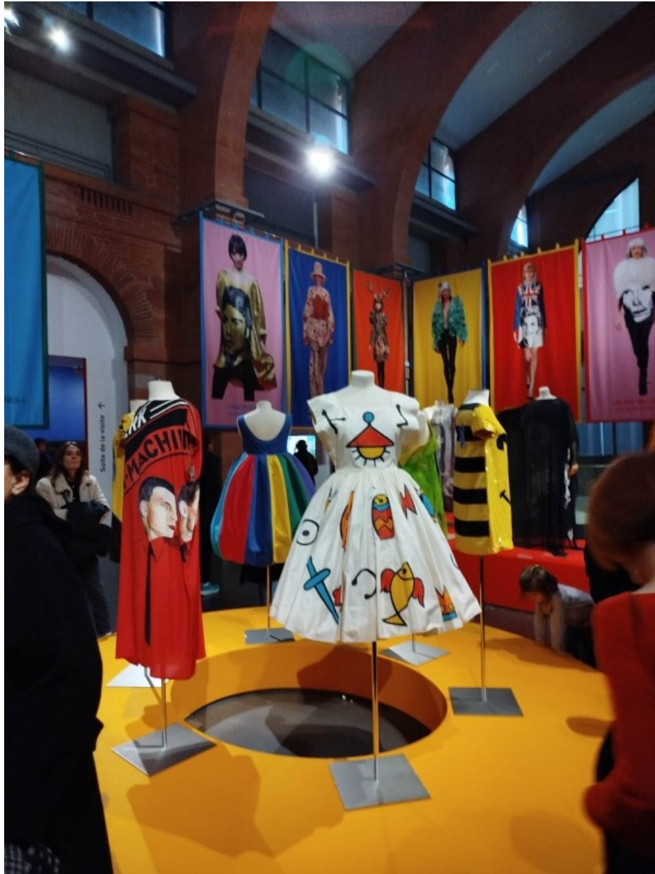
Exposition de l'Abattoir à Toulouse - 2026