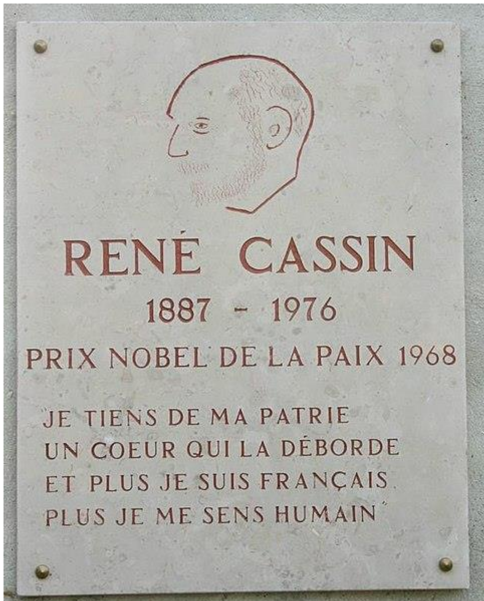
Plaque commémorative au centre communautaire israélite René Cassin à Rueil-Malmaison

Juge à la Cour Européenne des Droits de l'Homme de 1959 à 1976, il en est le président de 1965 à 1968.