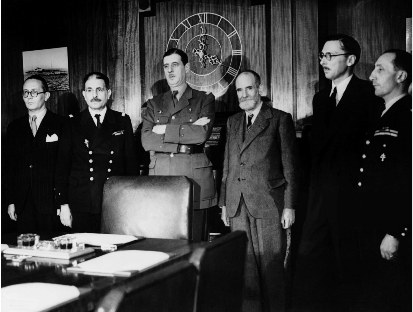
René Cassin au sein du Comité national français à Londres.

Il rédige le texte d'accord franco-britannique du 7 août 1940 et l'ensemble de la législation jusqu'à la Libération.