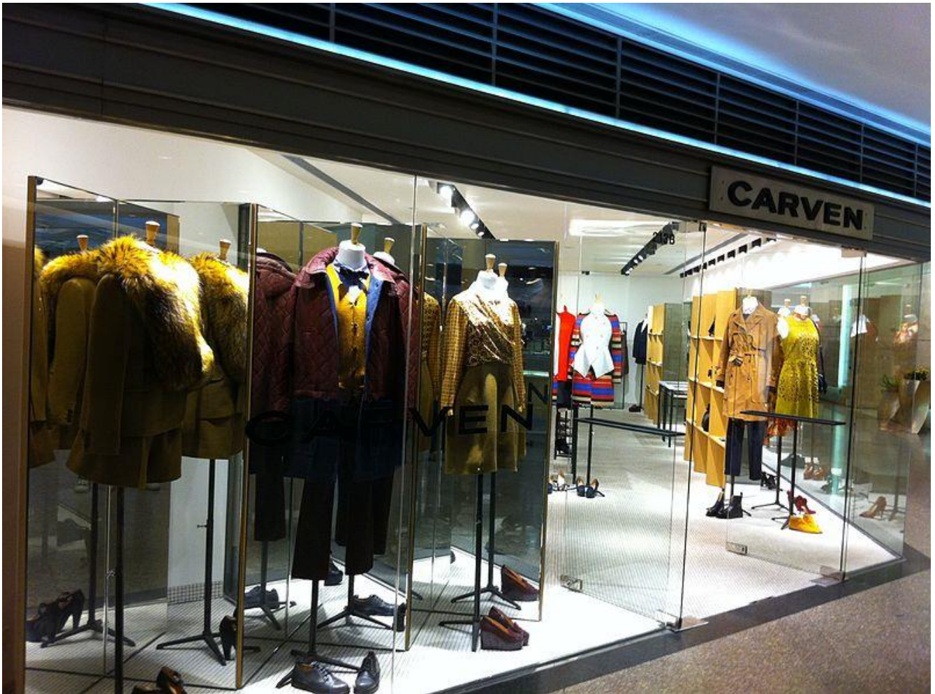
Boutique Carven à Hong-Kong

Le Rond-Point des Champs Élysées : quel plus bel emplacement pour installer sa maison de couture ! Elle a 34 ans et son pseudonyme Carven est une contraction de son prénom Carmen qu'elle n'aime pas et du nom de sa tante préférée Mme Boyriven.