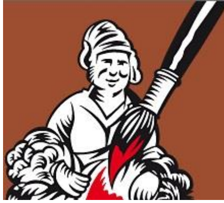
Ancien logo des Ateliers Marcel Carbonel (Création Michel Morosoff - Marseille)

Retrouvez Marcel Carbonel : https://www.youtube.com/watch?v=cAzP4xMcwA4