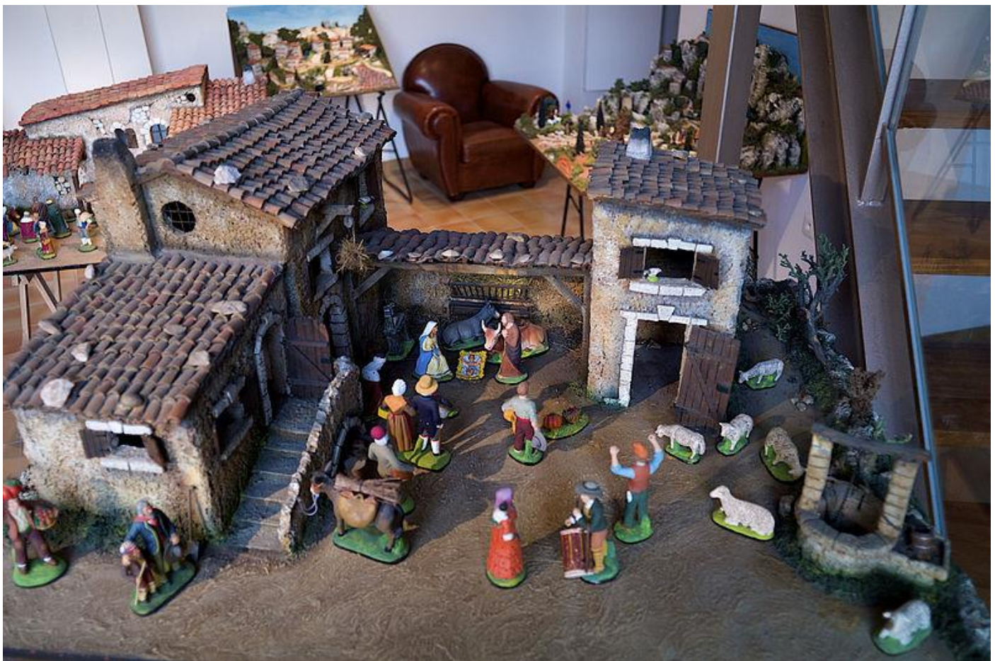
Crèche santons N°4 Marcel Carbonel

Le coup de patte « Carbonel » crée un style qui demeure très prisé des collectionneurs.