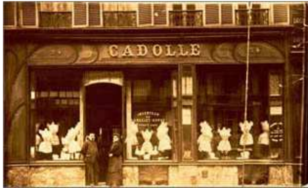
Boutique Cadolle au 24 rue de la Chaussée d'Antin à Paris