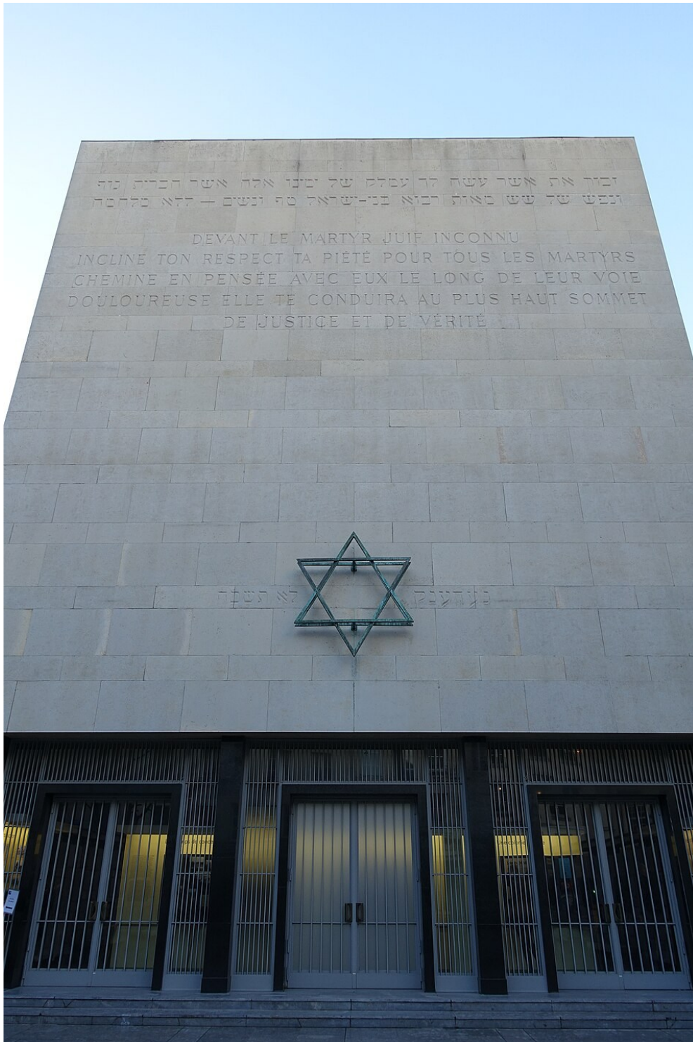
Mémorial de la Shoah

Ce dispositif diligenté par le Reich vise à fabriquer par milliers des faux billets en livres sterling et dollars américains afin d'inonder le marché et déstabiliser l'économie anglaise et américaine.