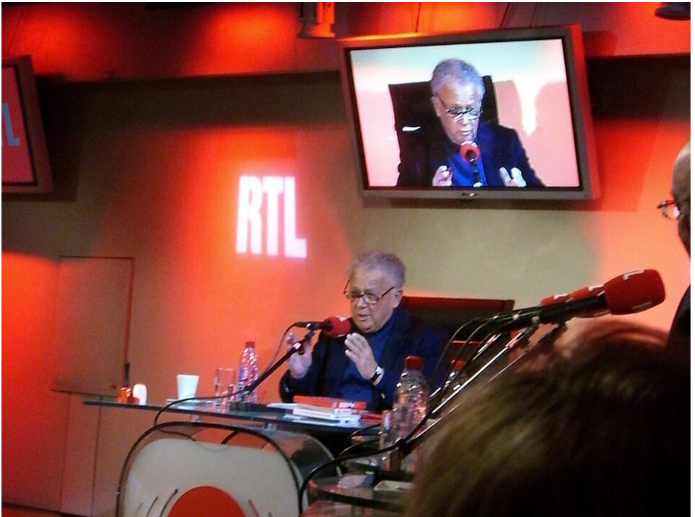
Philippe Bouvard dans son émission "Les Grosses Têtes" sur RTL en 2009

Lors de sa dernière chronique radiophonique sur RTL le 23 juin 2024, Bouvard âgé de 95 ans, annonce prendre sa retraite en janvier 2025 après 60 ans de carrière.