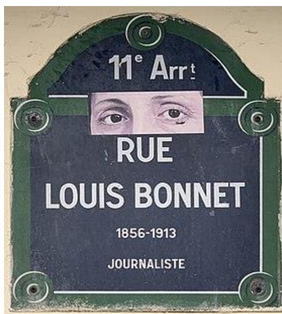
Une rue de Paris 11 e lui rend hommage au cœur de la « petite Auvergne »

Cet élan suscite dès 1900, la création de nombre d'amicales auvergnates, un phénomène unique en France !