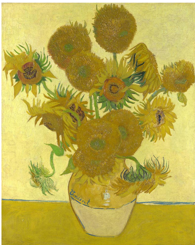
Tournesols dans un vase , 1888, huile sur toile (93 × 73 cm), Londres, National Gallery

Entre 1891 et 1925, Jo Bonger vend plus de 200 toiles du maître mais conserve certaines qui lui sont chères dont deux des Tournesols . Elle consent à en vendre une au National Gallery de Londres quelques mois avant son décès avec ce mot : C'est un déchirement mais c'est pour la gloire de Vincent !