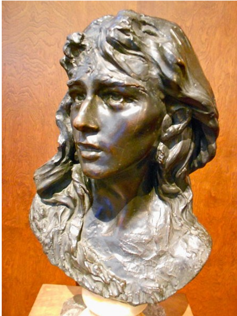
Mignon par Auguste Rodin - 1870

https://commons.wikimedia.org/wiki/File:Mignon_Rodin_Philly_1.JPG