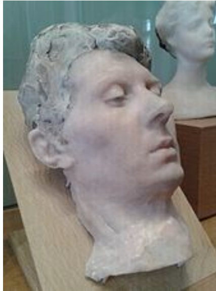
Rose Beuret (1911), pâte à modeler et pâte de verre