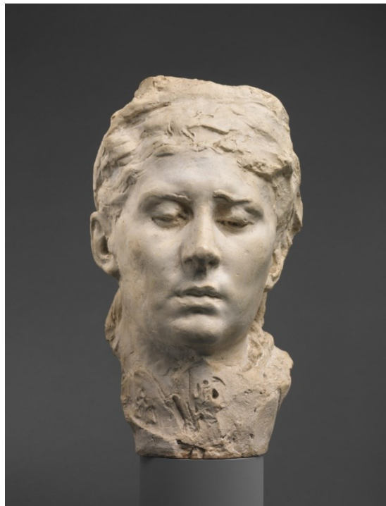
Masque de Rose Beuret par Auguste Rodin

https://commons.wikimedia.org/wiki/File:Mignon_Rodin_Philly_1.JPG