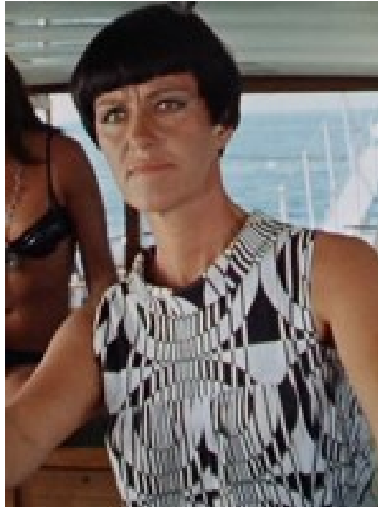
Maud de Belleroche dans le film Top Sensation 1969 où elle tient le rôle d'une dominatrice qui organise la dolce vita à bord de son yacht

Décédée le 19 février 2017 à Villerville Calvados 14