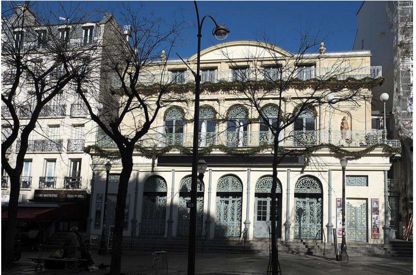
Théâtre du Gymnase – Marie Bell -