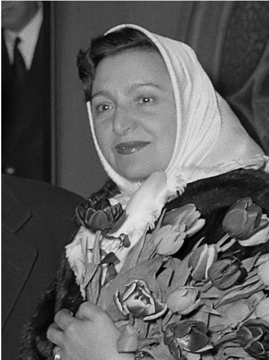
Marie Bell en 1956

Cet établissement sera rebaptisé à son décès, Théâtre Marie Bell pour honorer son rôle d'actrice sur les scènes du monde ainsi que de metteur en scène.