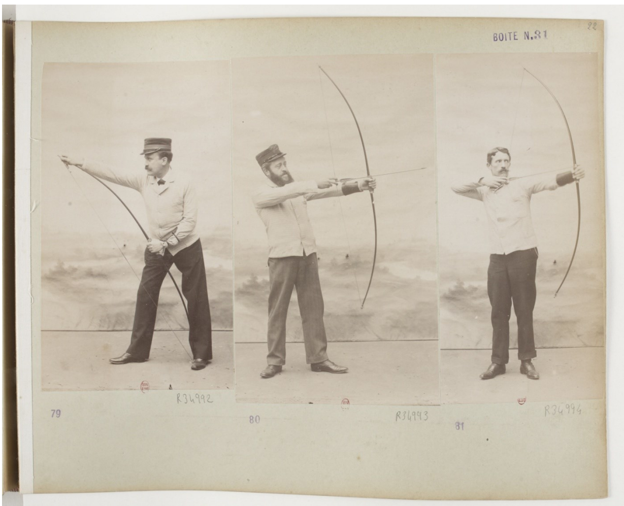
79 R34992 80 R34993 81 R34994