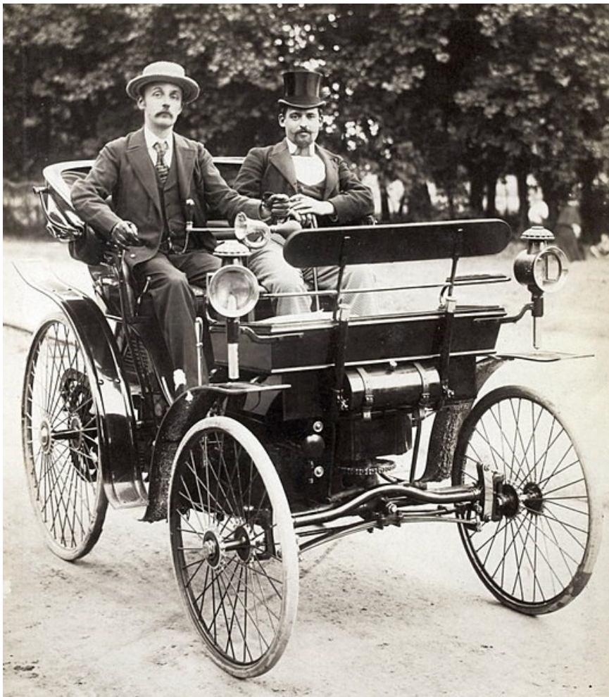
Ernest Archdeacon en 1894 sur Peugeot type 3.jpg