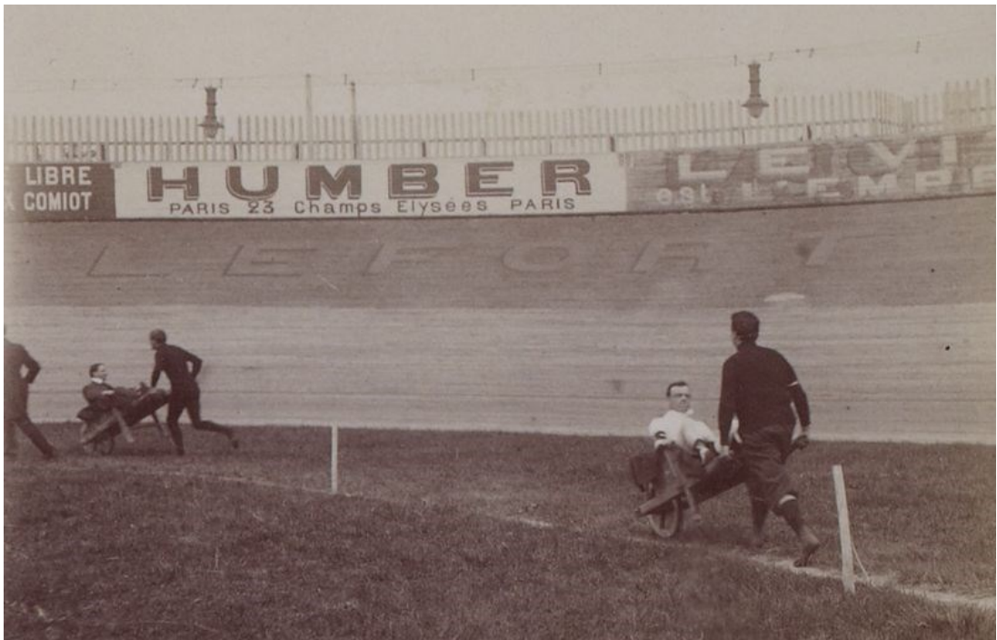
Course de brouettes des Artistes de Paris en 1906 au stade Buffalo