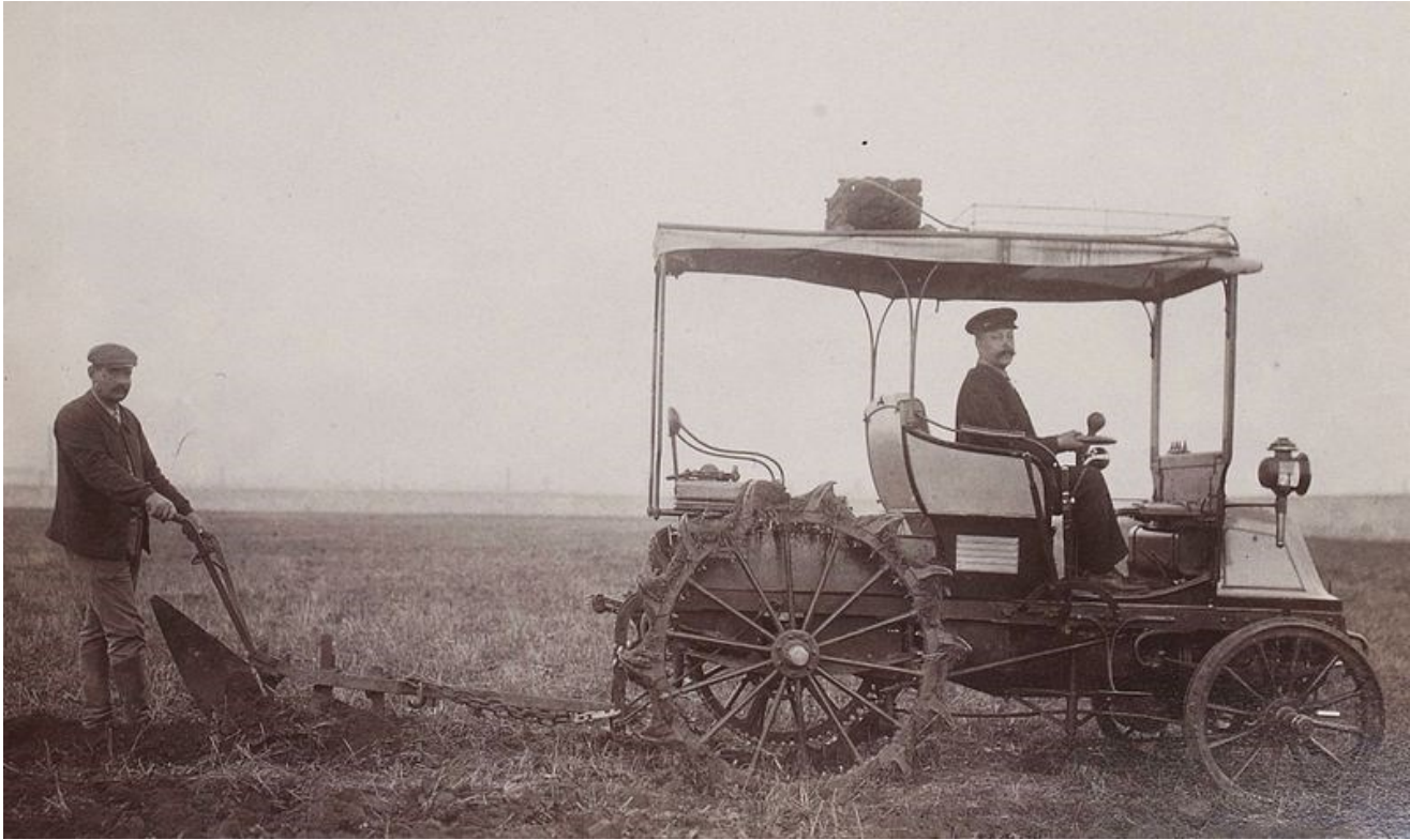
Charrue automobile en 1901.