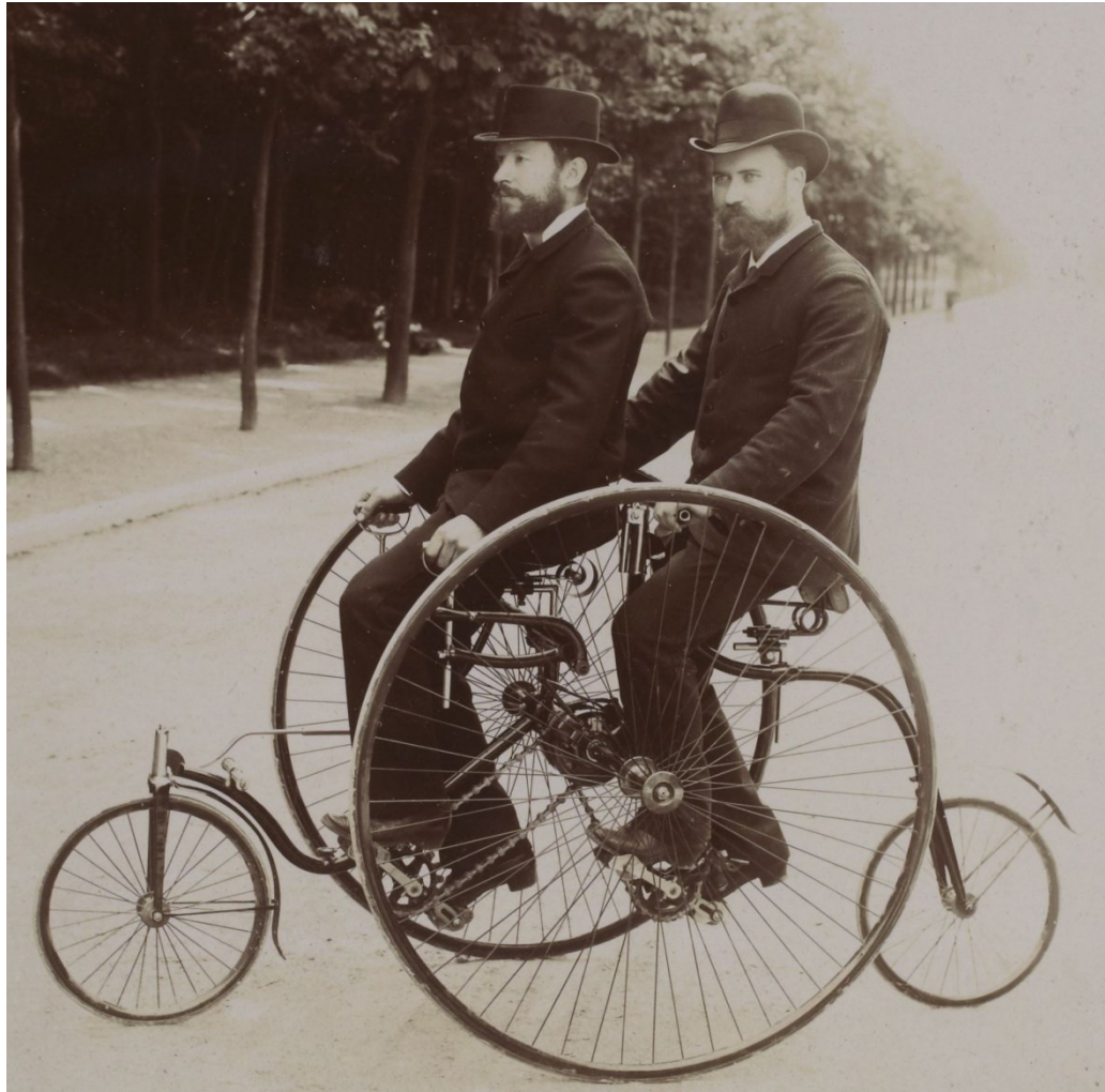
Léon Serpollet et Adolphe Clément-Bayard sur quadricycle Clément (1894).jpg