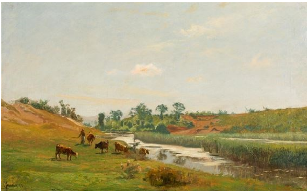
Paysage et vaches - 1876