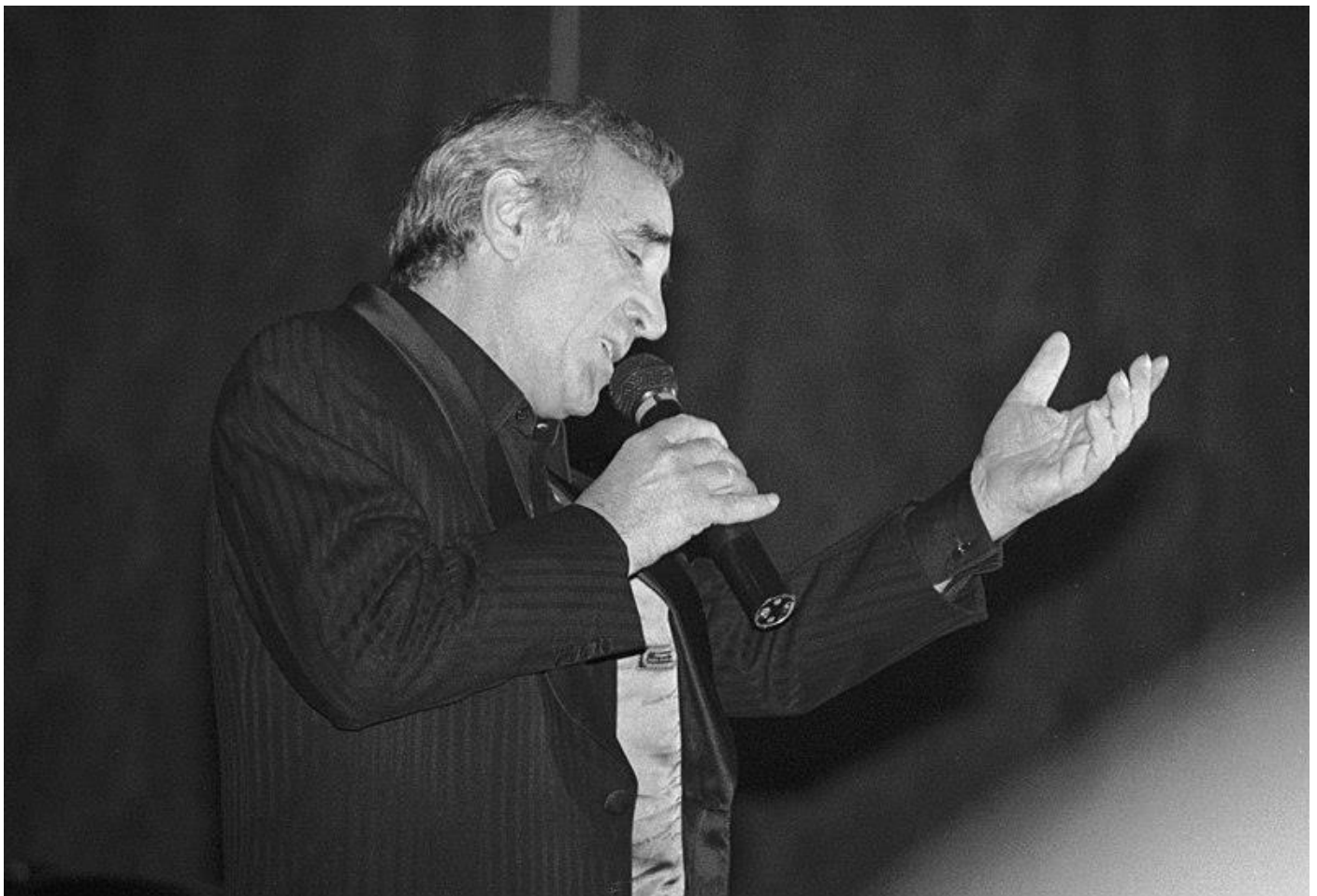
Aznavour en concert à Deauville en 1988

« Toi, plus que les autres tu me ressembles. Tu as quelque chose dans le ventre... Avec tes chansons, si tu les chantes toi-même, tu sauras autant que moi secouer le populaire.