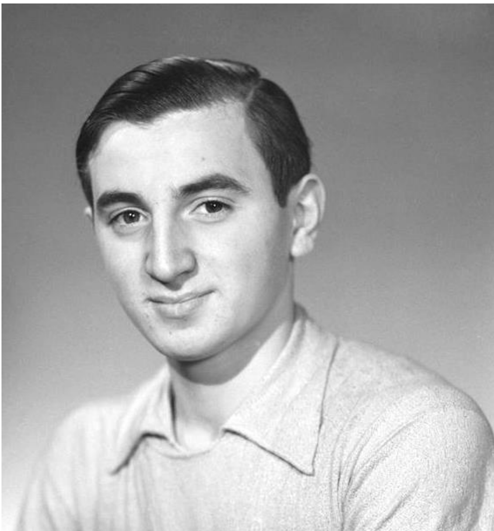
Aznavour en 1941

Le biopic Monsieur Aznavour sorti en octobre 2024 de Mehdi Idir et Grand Corps Malade avec Tahar Rahim est un chef d'œuvre du genre tant il restitue de façon émouvante l'exceptionnel parcours de Charles Aznavour.