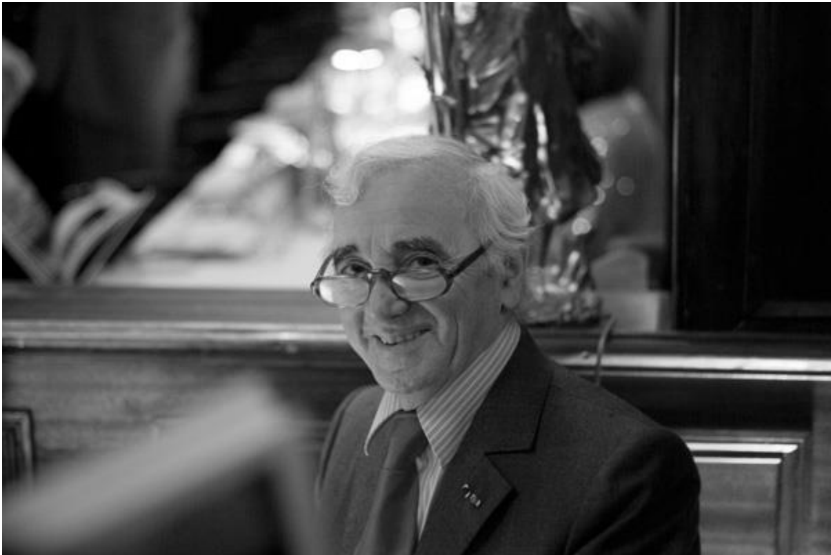
Aznavour en 2007

Cet immense artiste quitte le monde et la chanson le 1 er jour d'octobre 2018 à l'âge de 94 ans et la France lui rend un hommage national.