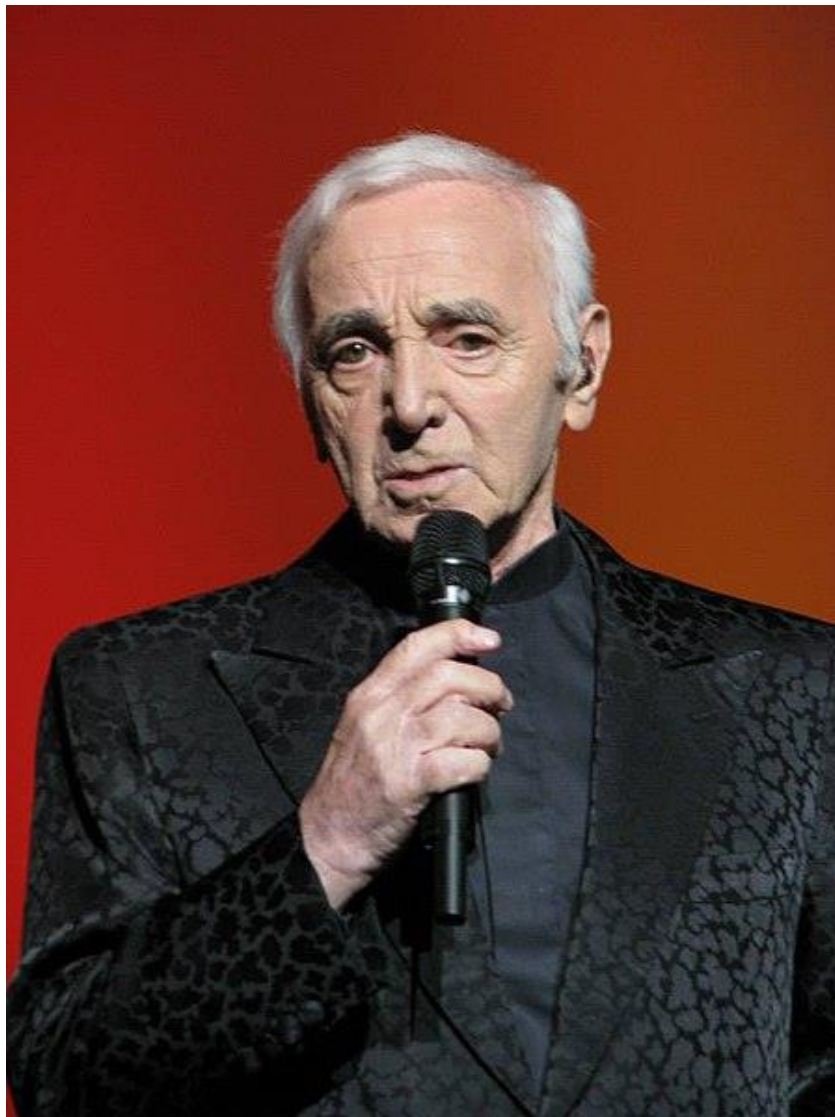
Aznavour en 2014

Décédé le 1 er octobre 2018 à Mouriès Bouches-du-Rhône 13