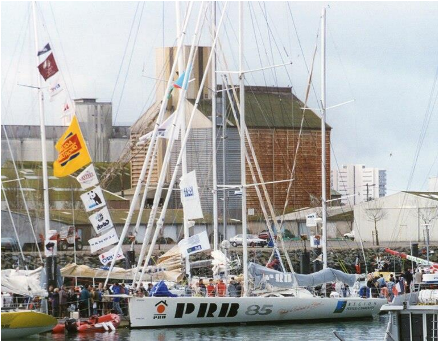
PRB bateau d'Isabelle Autissier, au départ du Vendée Globe 1996-1997

Devenue alors la 1 ère femme à boucler un tour du monde en solitaire lors du BOC Challenge, où elle termine 7 e au palmarès, elle en hérite une notoriété propice à ouvrir des portes lors de la chasse aux sponsors indispensables pour faire construire un bateau.