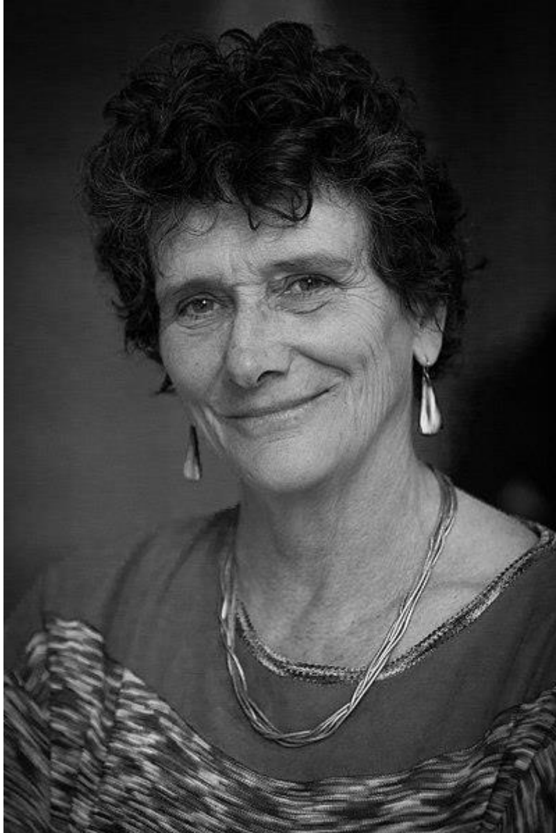
Isabelle Autissier en 2015