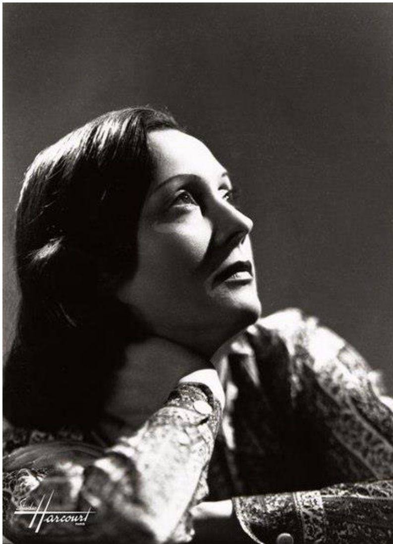
Arletty en 1946

La beauté d'Arletty en fait la muse des peintres et notamment Marie Laurencin et Van Dongen qui la prennent pour modèle.