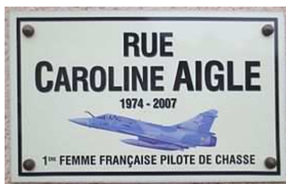
Plaque de rue proche de la base aérienne de Dijon-Longvic

Merci à Jean-François Marcaud de m'avoir mis sur la piste de cette femme d'exception.