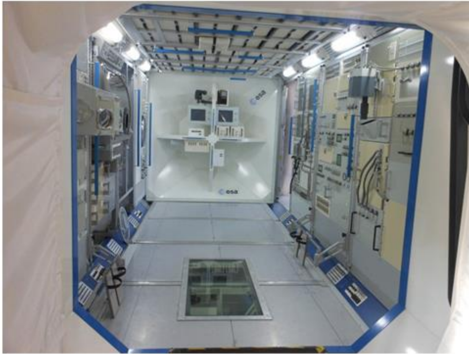
Intérieur du laboratoire spatial européen à Cologne (Allemagne)