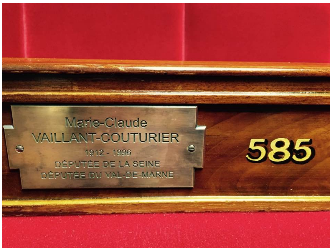
Plaque sur les bancs de l'hémicycle de l'Assemblée nationale https://fr.wikipedia.org/wiki/Marie-Claude_Vaillant-Couturier