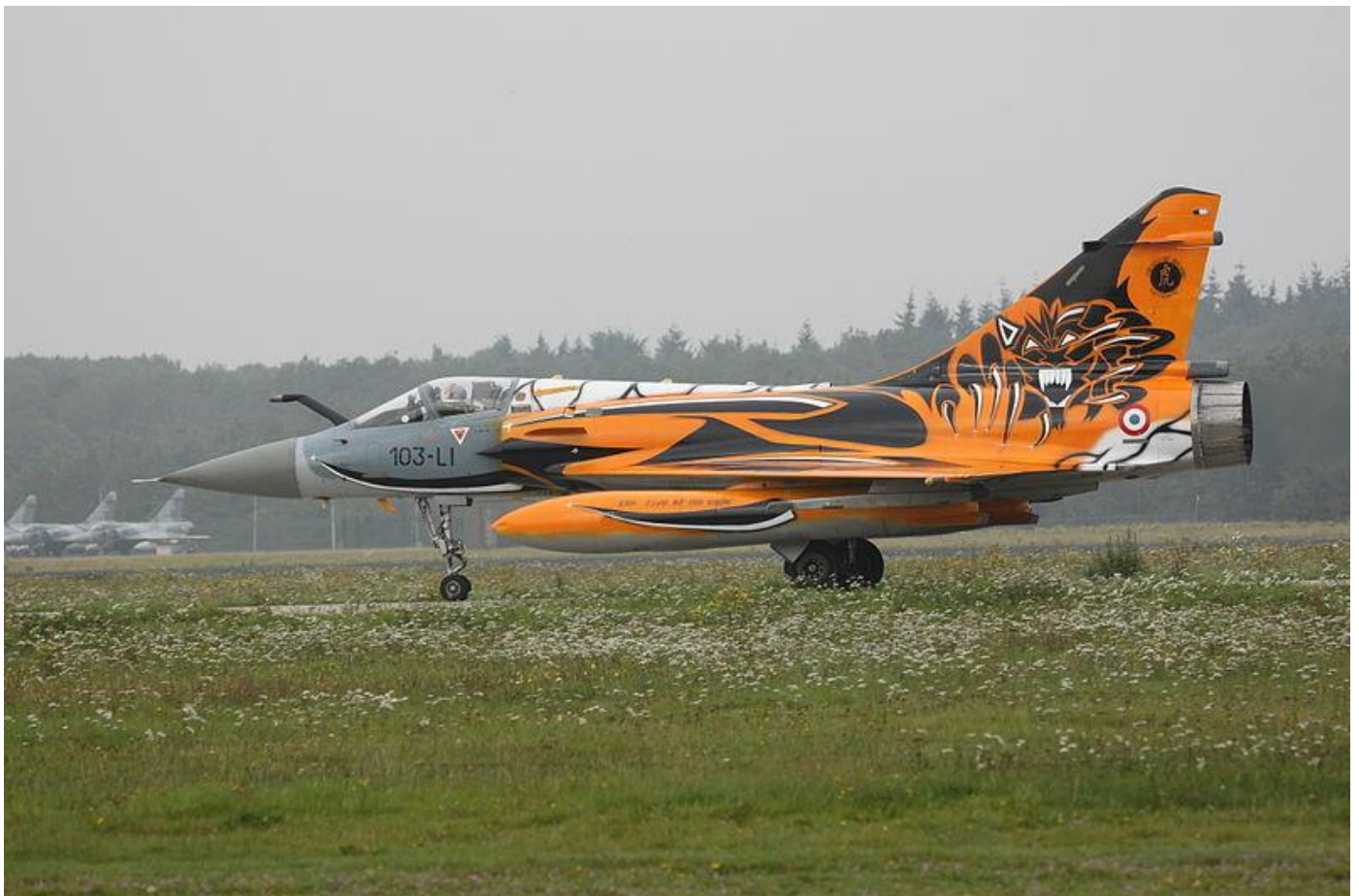
Mirage 2000C Tiger Meet 2010 "The year of the Tiger" signé Régis Rocca