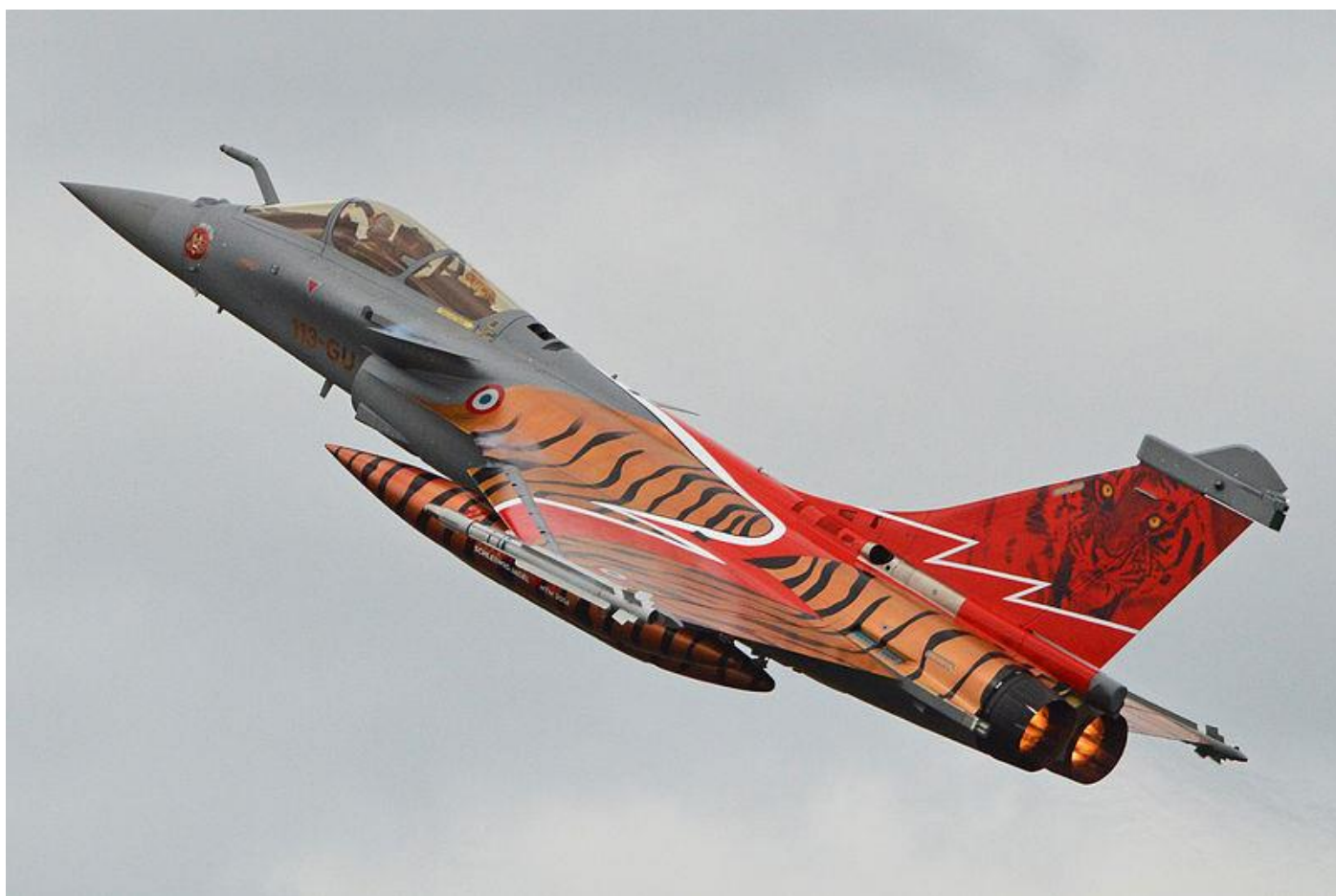
Rafale Tiger Meet 2014 "Thundertiger" signé Régis Rocca

Puis, dans la Haute-Marne, pour l'Escadron de Saint-Dizier, il crée le Rafale qui lui vaut une 3 e place en Norvège en 2013. Il glane des secondes places en Allemagne et en Turquie en 2015.