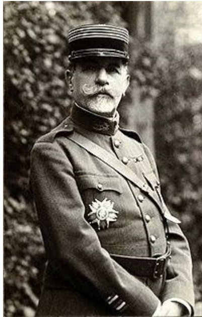
Samuel Pozzi en 1918