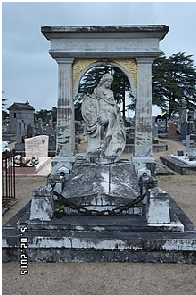
Sépulture Poulain à Blois