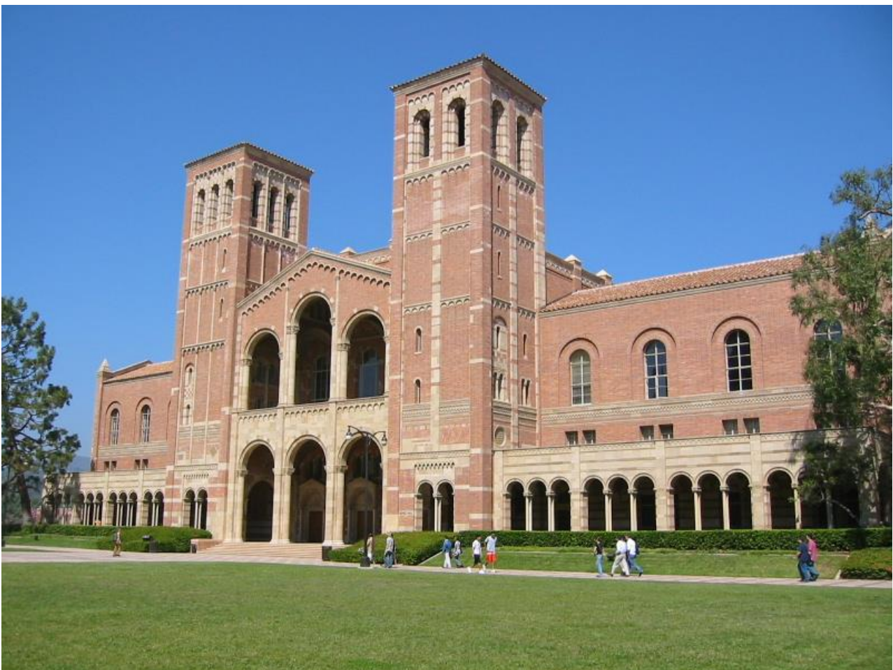
Le Royce Hall (1926) de l'UCLA, l'université dont Ostrom est diplômée.

Ce cadre d'analyse ( Institutional Analysis and Development - IAD ) est rapidement recommandé par les institutions internationales.