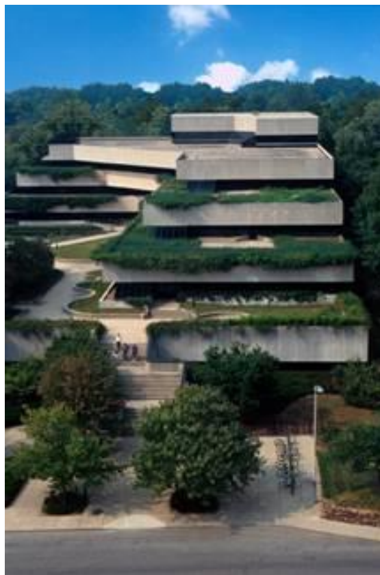
École des affaires publiques et environnementales de l'université de l'Indiana à Bloomington où Ostrom a enseigné.

Mais dans les années 1950, pour une femme diplômée, dur-dur de trouver un emploi. Elle finit par devenir assistante de ressources humaines dans une firme qui embauche pour la 1 ère fois une femme dans ce métier. C'est ce travail qui lui donnera envie de poursuivre ses études.