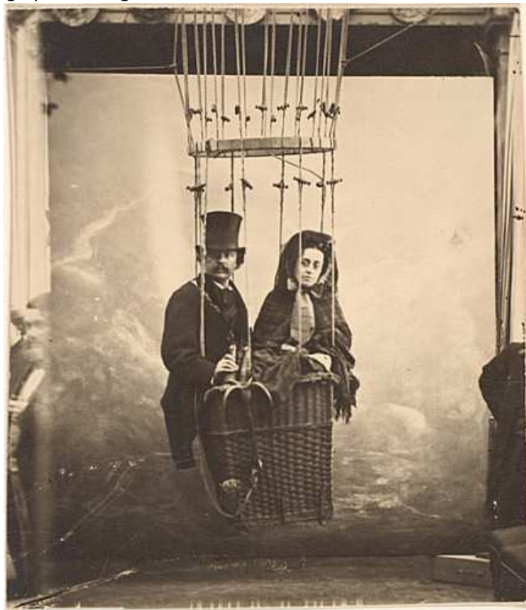
Nadar en ballon avec son épouse (photo prise en studio)

Il expérimente l'éclairage à la poudre de magnésium et dépose le brevet de photographie à la lumière artificielle en février 1861. Conscient que son invention permet de révéler au public, le monde souterrain, il se lance dans un nouveau chantier : la photographie des égouts et des catacombes de Paris.