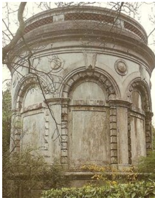
Le réservoir de Clamart construit en 1888 par Joseph Monier

En 1889, son fils Pierre revenu à Paris crée la société « Entreprise Monier Fils », à La-Plaine-Saint-Denis, qui fera quelques constructions en ciment armé. À partir de 1899 cette société existe sous le nom de « Société des Travaux en ciment » et participe à la construction du pavillon du Cambodge à l'Exposition universelle de 1900.