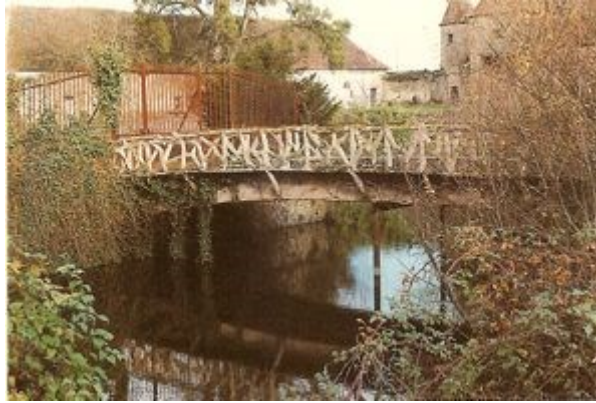
Pont de Chazelet

En 1875, on retrouve l'entreprise Joseph Monier chargée de concevoir et réaliser dans le château de Chazelet, dans le Val-de-Loire, ce qui sera le premier pont en ciment armé du Monde. D'une longueur de 13,80m et une largeur de 4,25m, il permet de franchir les douves du château.