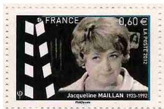
La Poste l'honore dans une plaquette de 6 timbres, sortie en octobre 2012 et dédiée aux acteurs de cinéma.

Elle meurt le 12 mai 1992, dans son appartement parisien.